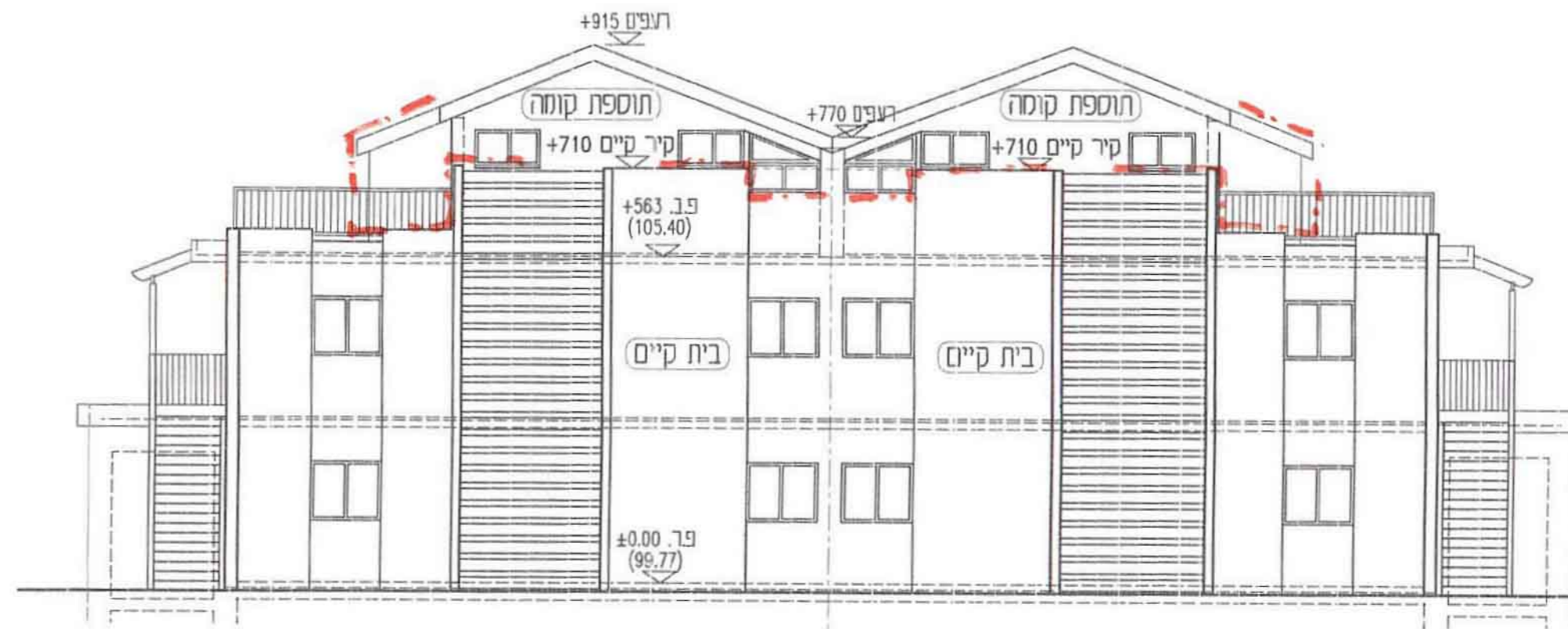
חזית רחוב (צפונית) 1 : 100

PM 4.3.02 משרד הפנים מהוז הצפון חוק התכנון והבניה תשכ"ה 1965 אישור תכנית מס. 12671 הועדה המחוזית לתכנון ובינה החליטה ביום 5.6.02 לאשר את התכנית סמנכ"ל לתכנון