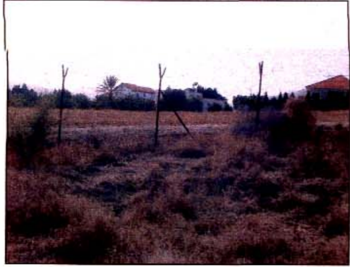
ו. בתי מגורים בקרבת הכביש