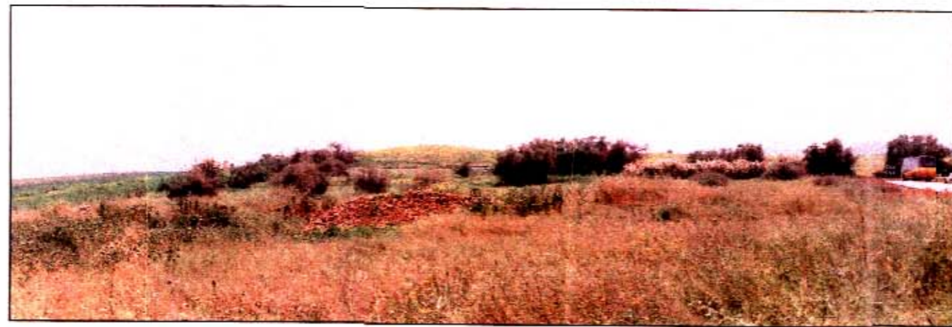
ז. שמורת עין מלקוח ותל מלקוח