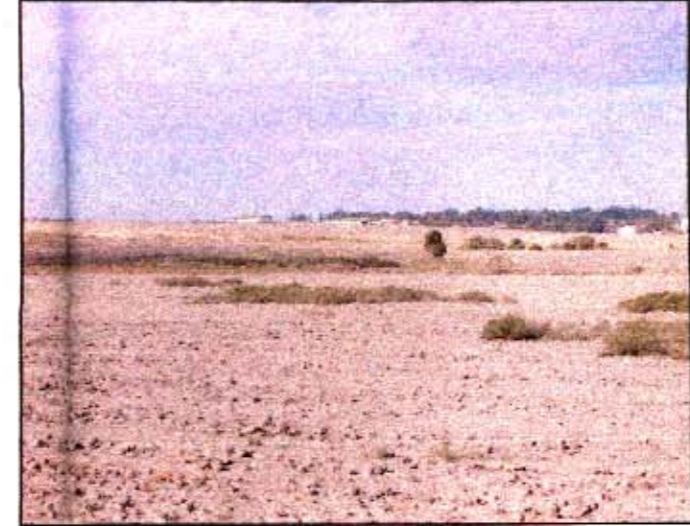
ב. המעינות מדרום לעין הנצי"ב