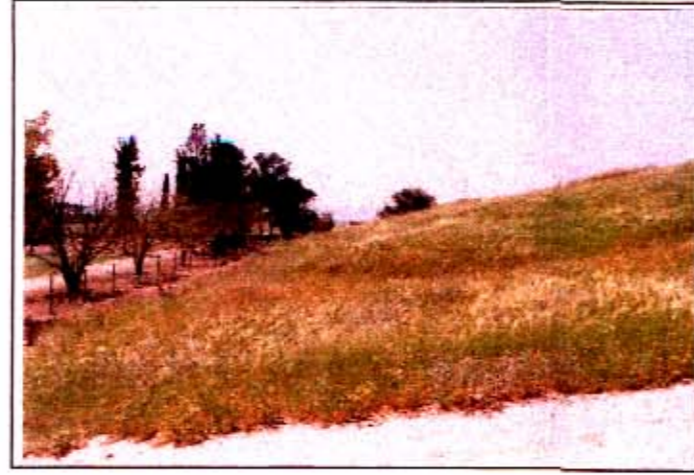
ד. גבעות הבר