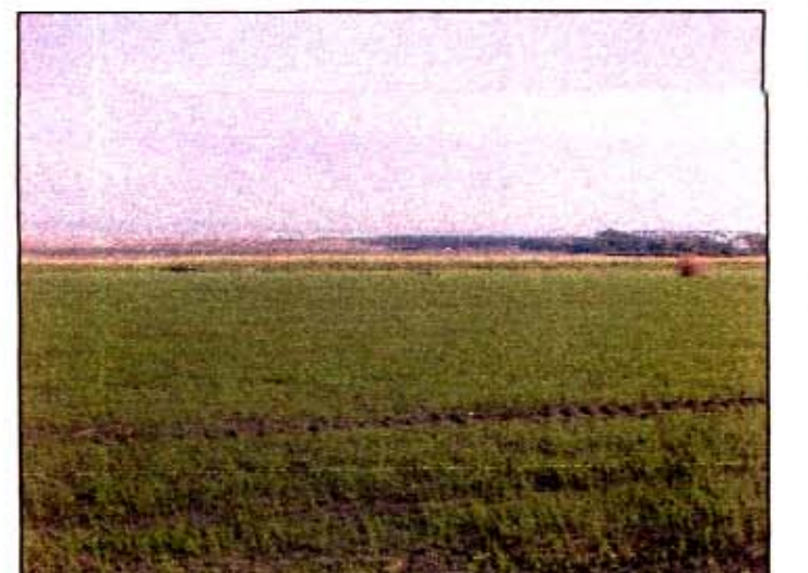
א. המישור הזקלאי והרי ירדן