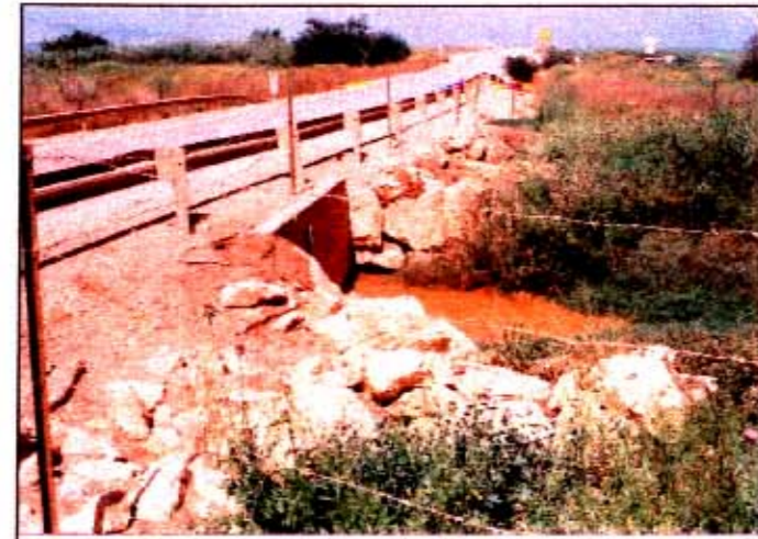
ט. נחל בזק, המעביר מתחת לכביש הקיים ואפיק הנחל