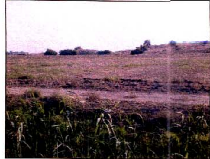
ג. גבעות הבר משתפלות אל השדות