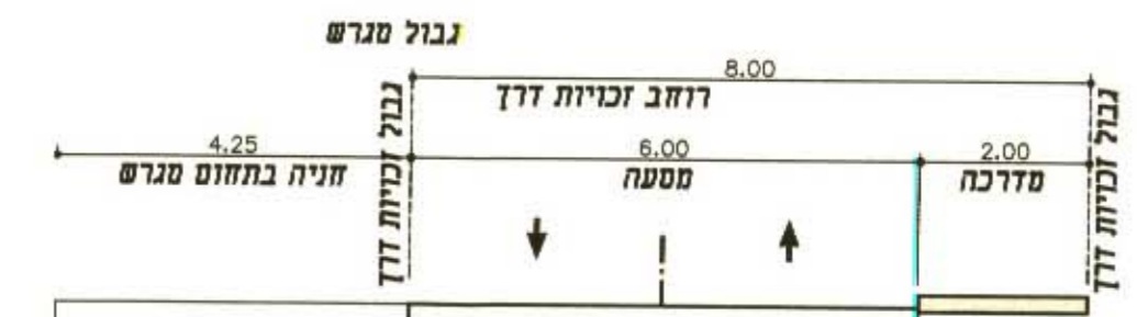
חתך טיפוסי בכבישים מסי' 2, 4 R2