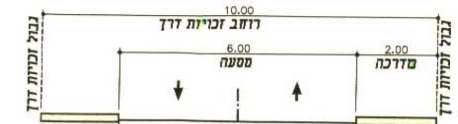
חתך טיפוסי בכביש מסי' 3 R3