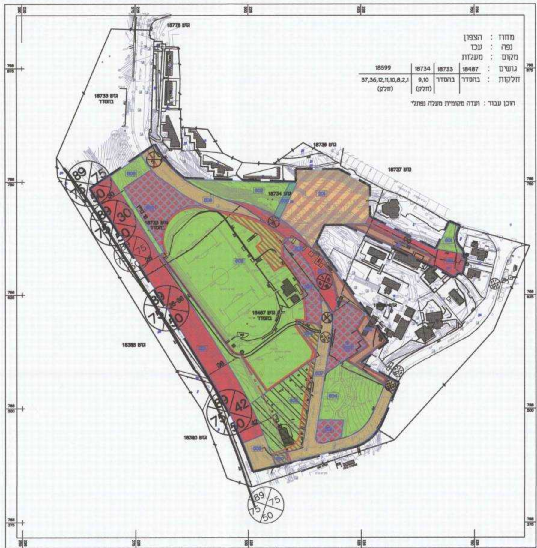
מצב מאושר קניס 1 : 2500