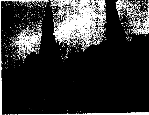
תמונה 6 : ברזים על רקע טרשים ומצוקים