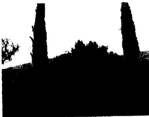
תמונה 2: זיתים וברזשים בפארק המרכזי