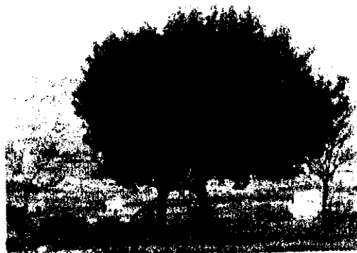
תמונה 1: חרובים ותאנים בפארק המרכזי