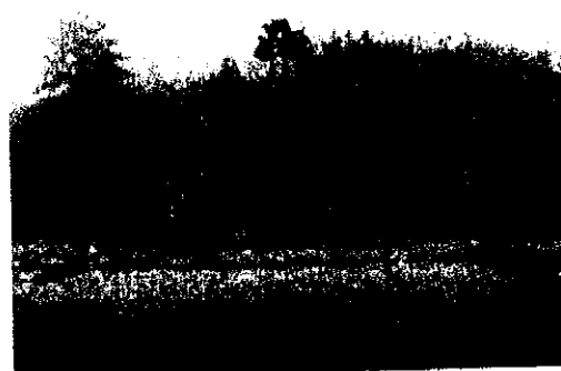
תמונה 3: תאנים בגבול מבנה ציבורי