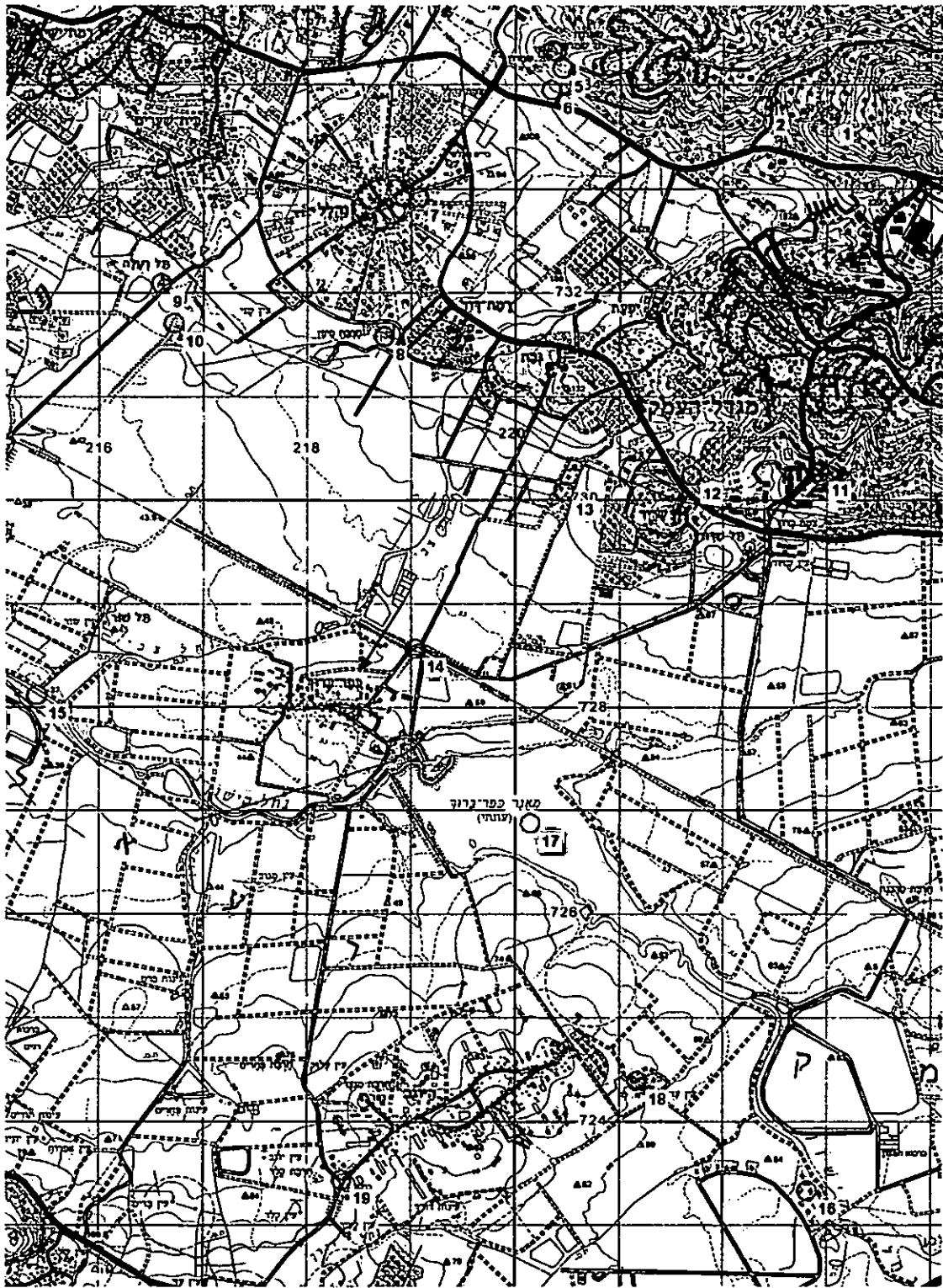
תרשים 1 - תרשים סביבה קב"מ 1:50000