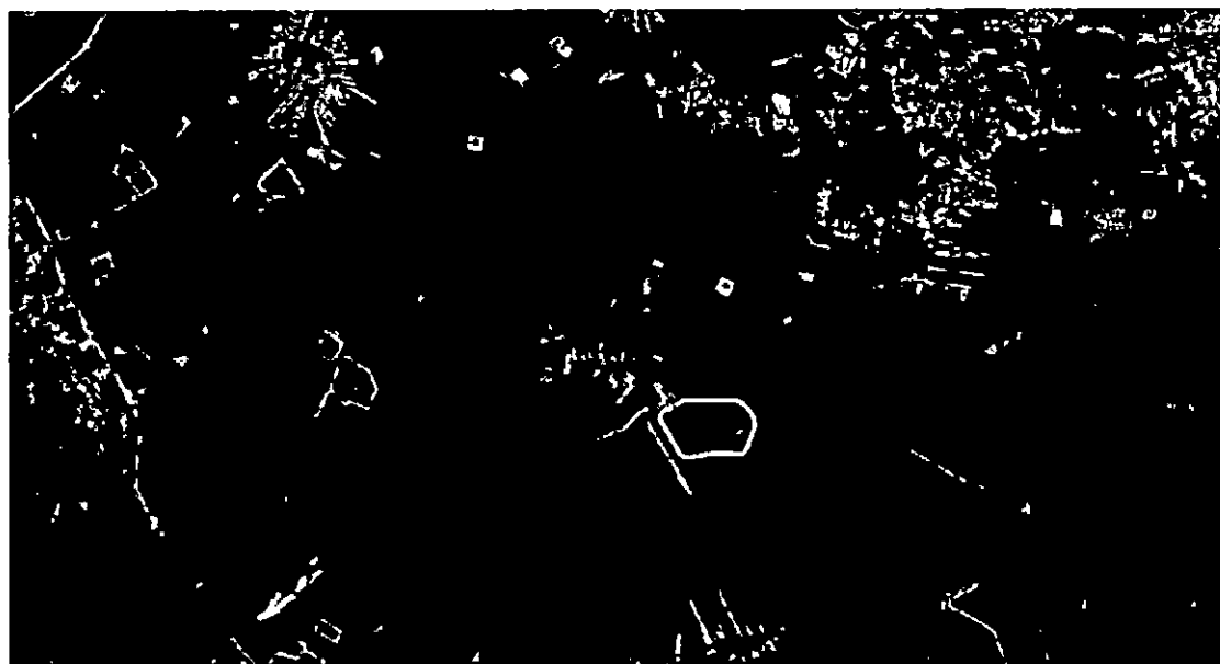
תרשים 3 – תרשים אורטופוטו2