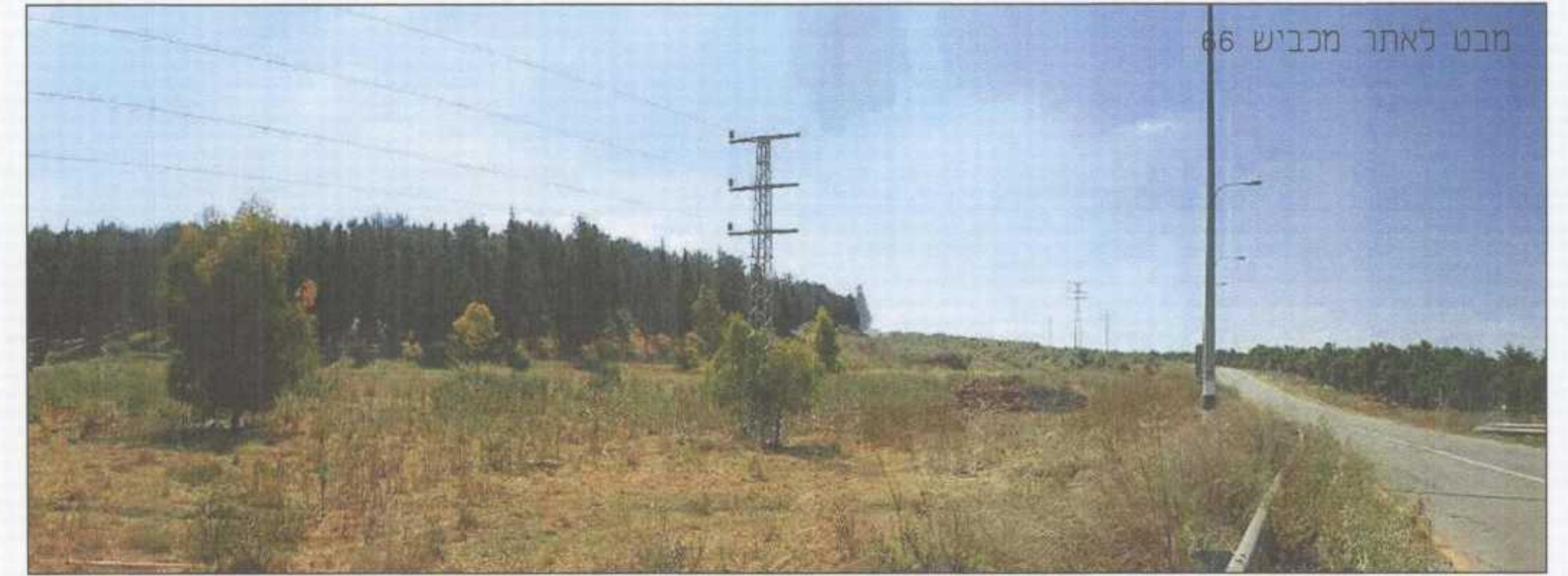
מבט לאתר מכביש 66

מקרא אזור ממנו האתר נצפה תחנת סאלם זאלפה