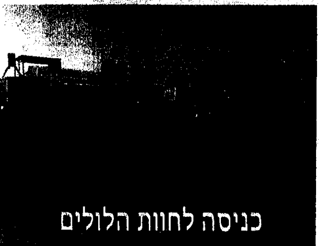
כניסה לחוות הלולים