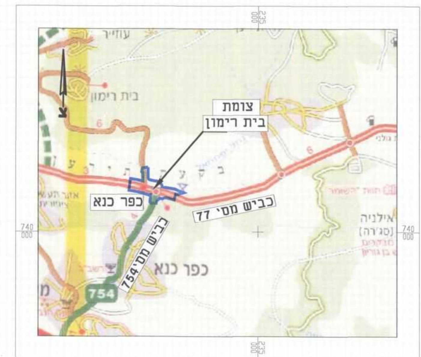
תרשים התכנית קו"מ 1:50,000