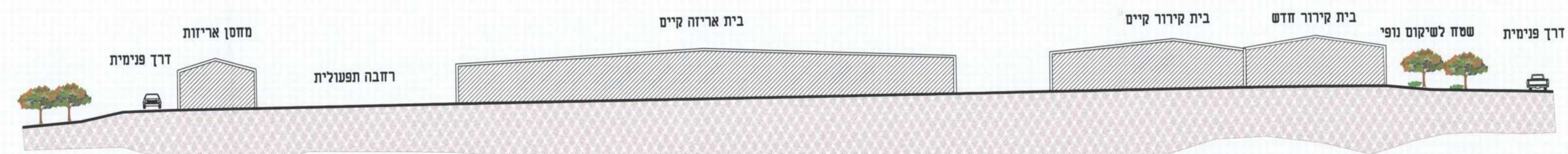
חתך אורך 1:500