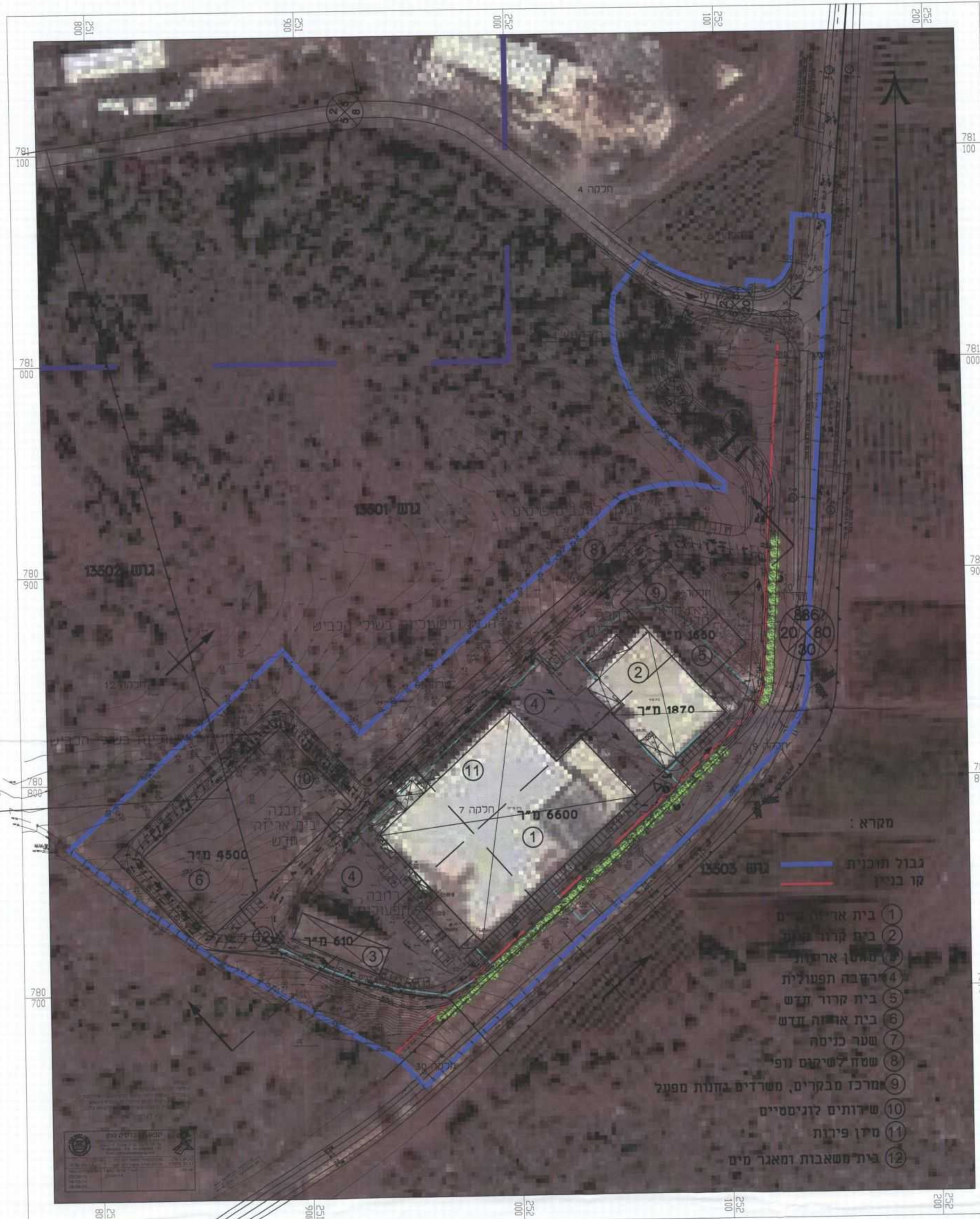
תכנית בינוי על רקע תצלום אוויר קנ"מ 1250 : 1