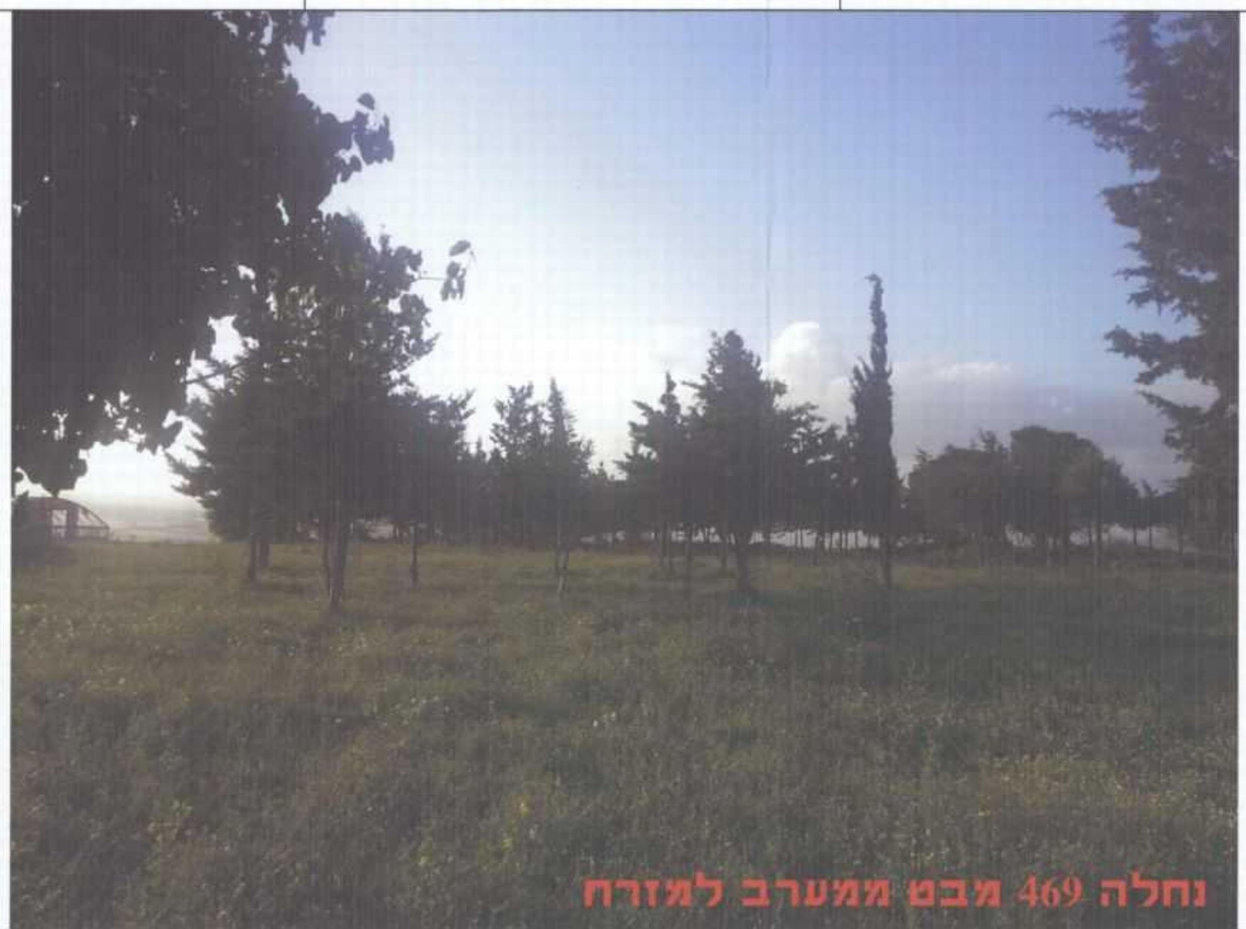
נחלה 469 מבט ממערב למזרח