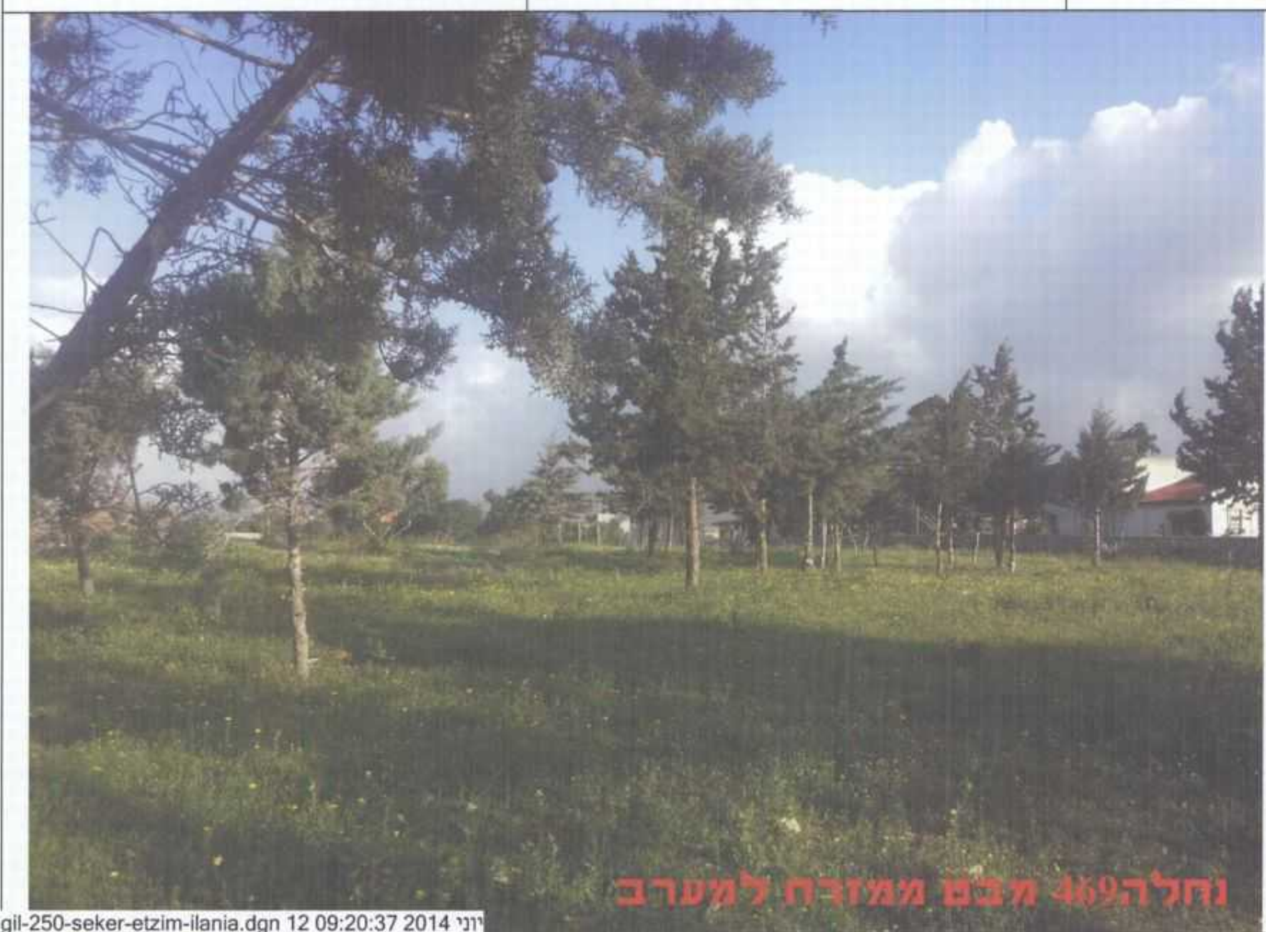
נחלה 469 מבט ממזרח למערב