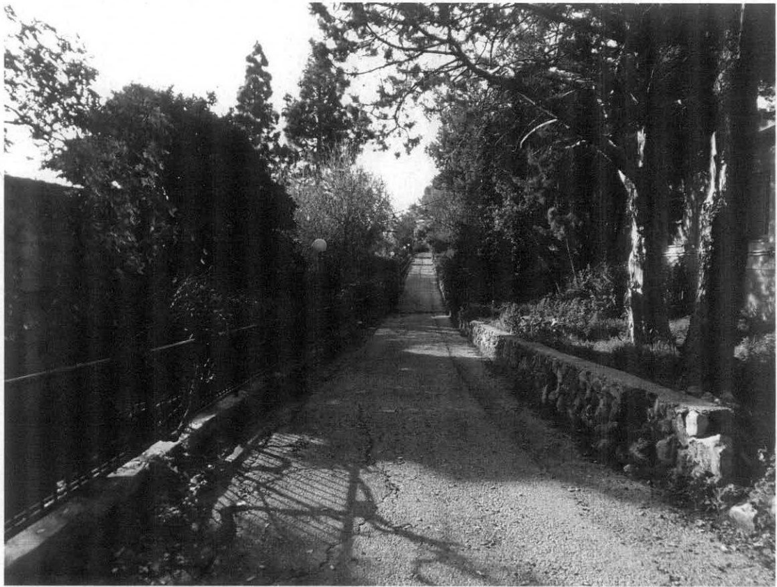
עורך המסמך: אדר' נוף נפתלי הבורסי