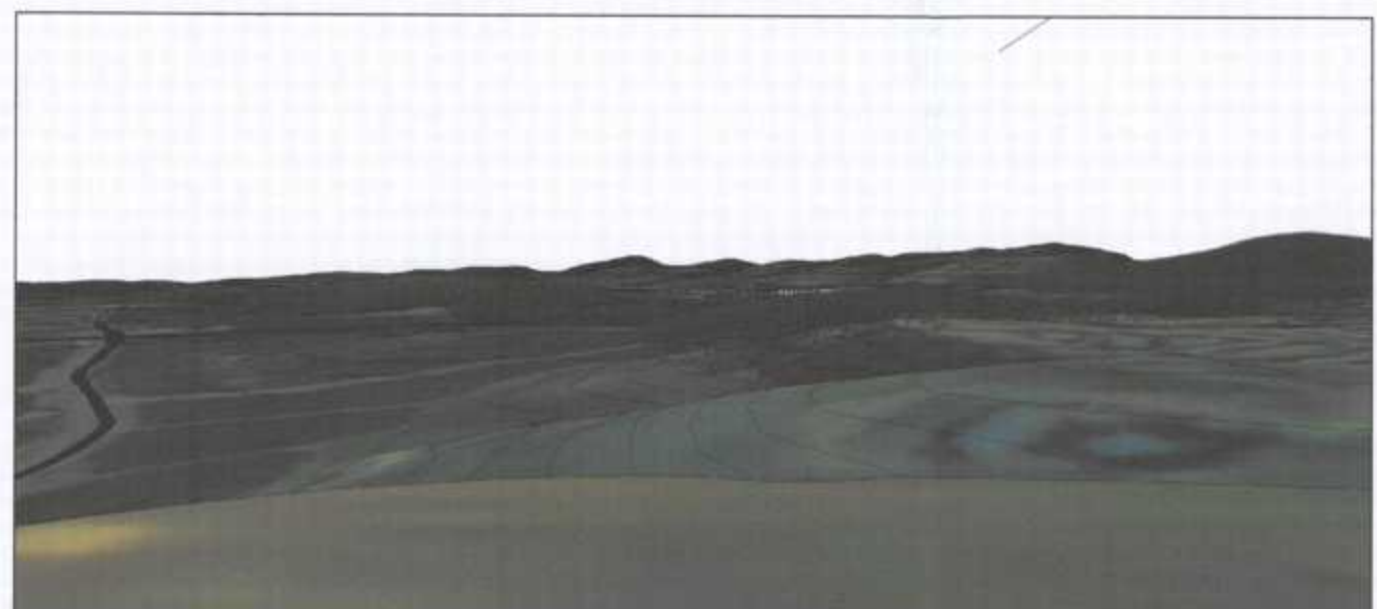
מבט מתל מגידו לכיוון דרום