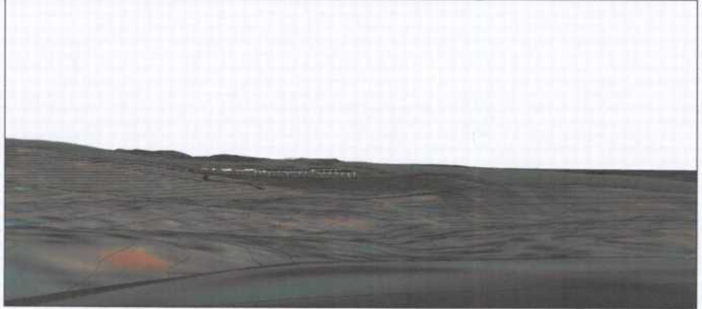
מבט מזלפה לכיוון צפון