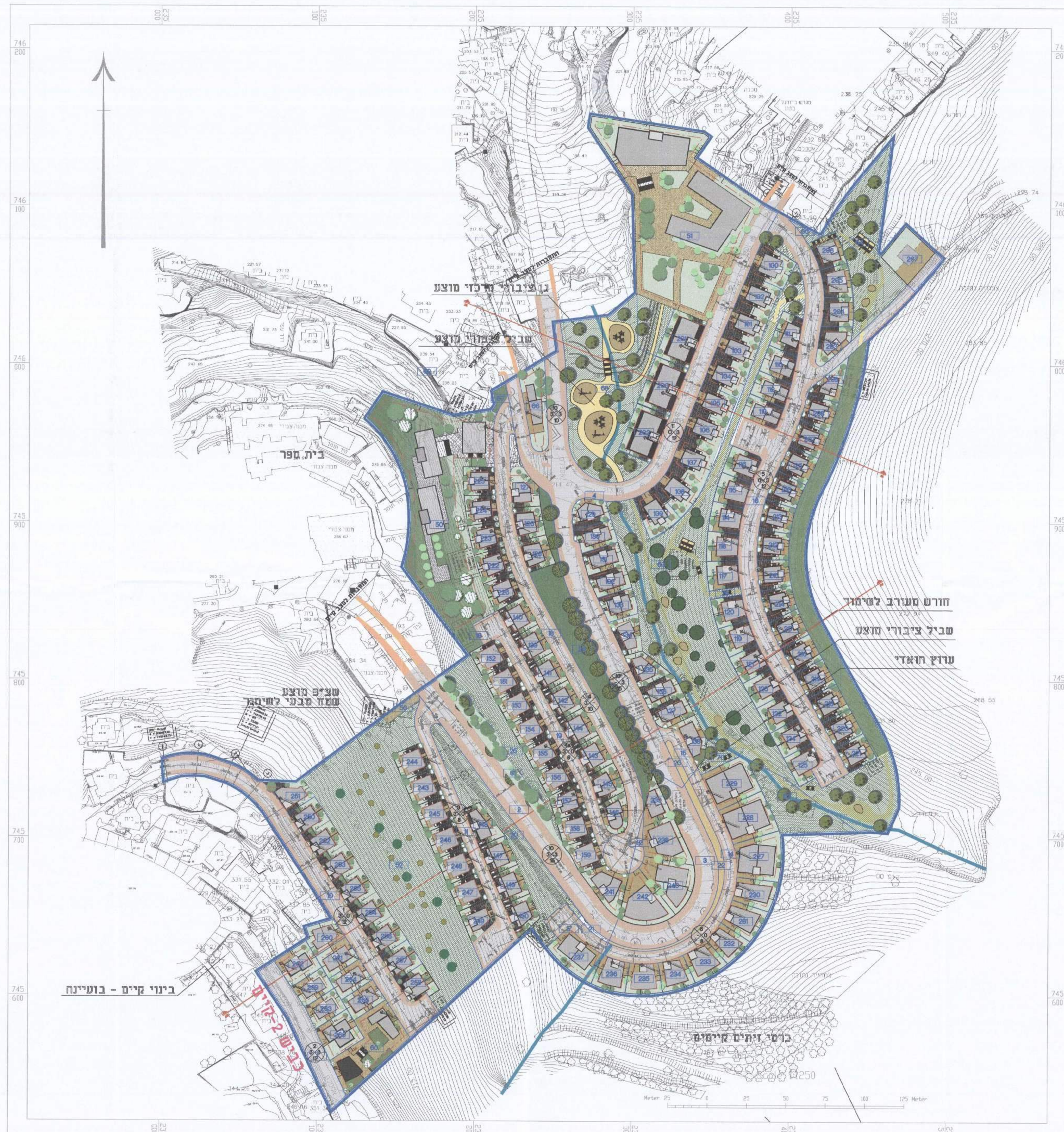
תכנית בנייני // 1:1250