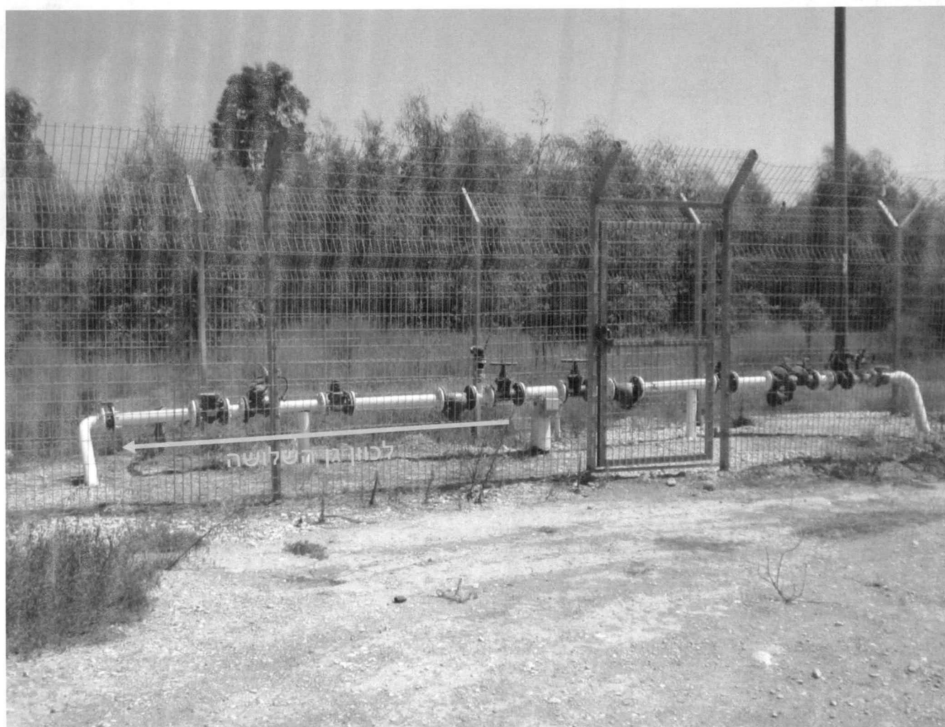
תמונה 1 - חיבור המים של אתר גן השלושה מהרשת של תאגיד אפיקי מים.