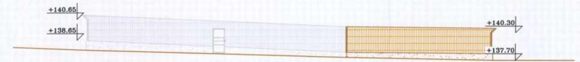
חזית מערבית 1:200