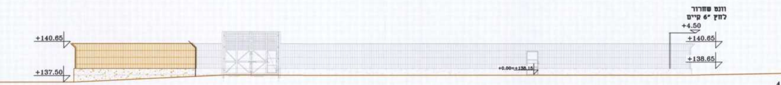
חזית צפונית 1:200