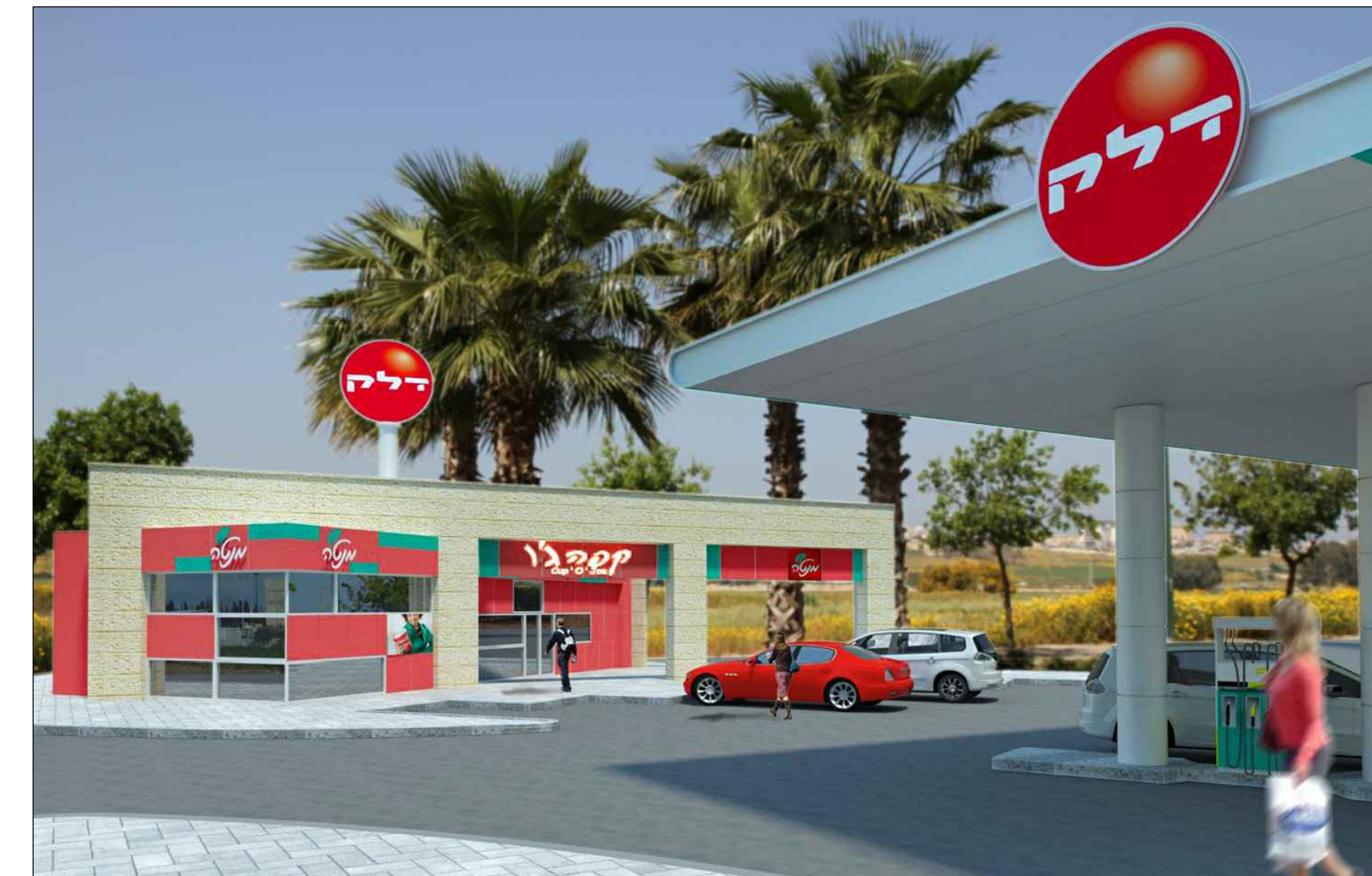
מבט אל התחנה