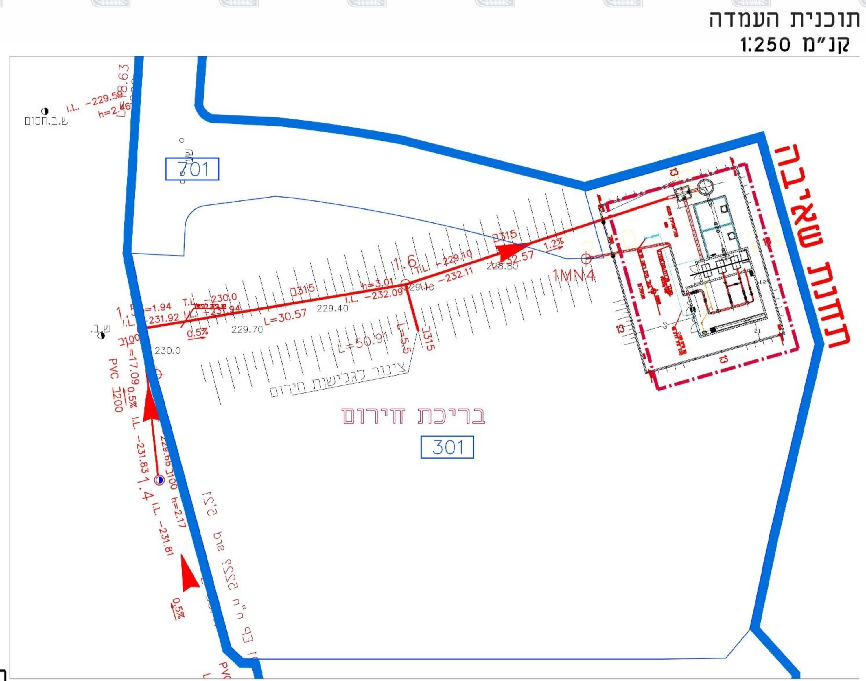
תוכנית העמדה קנ"מ 1:250