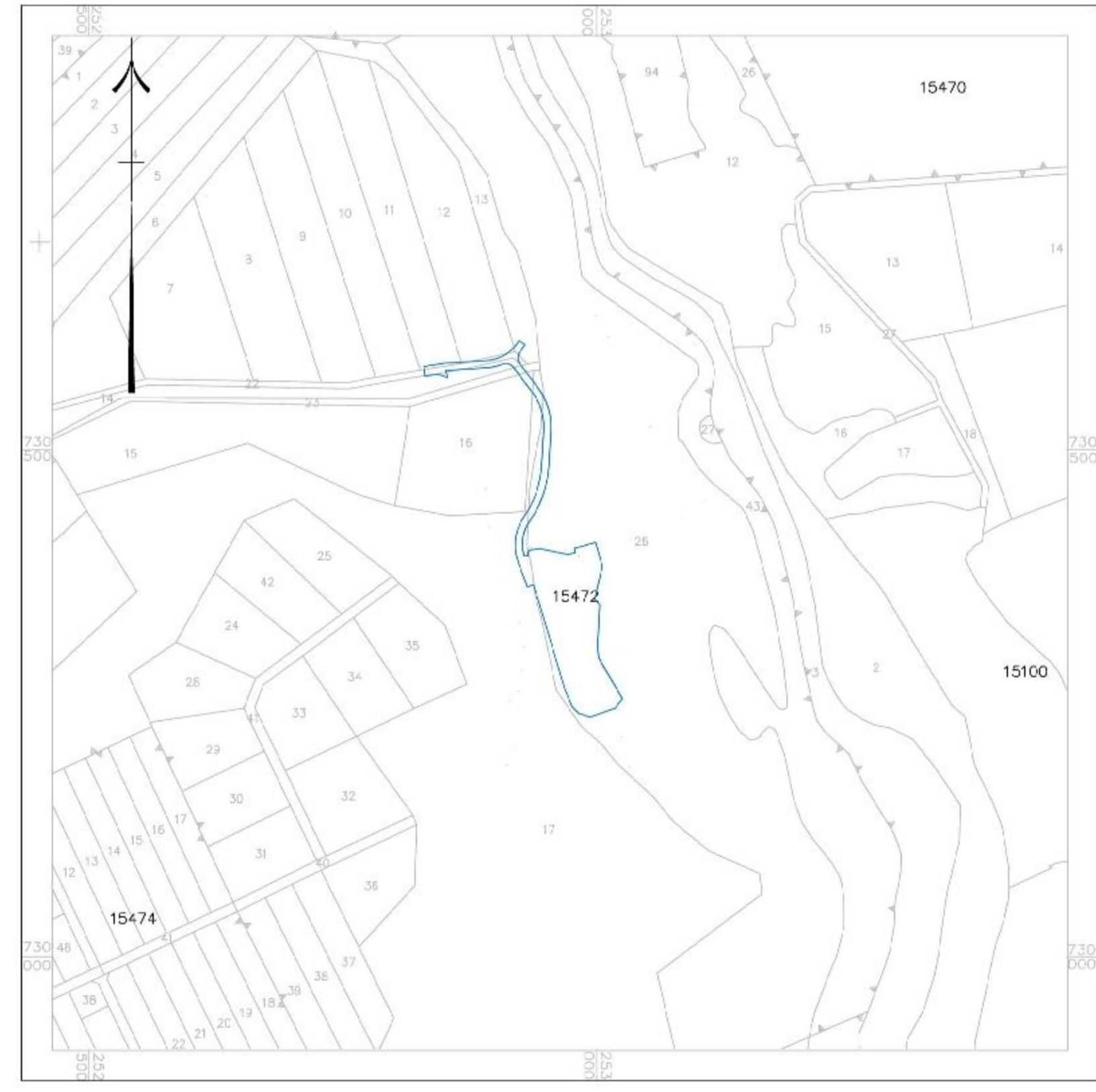
תרשים סביבה קנ"מ 1:5000