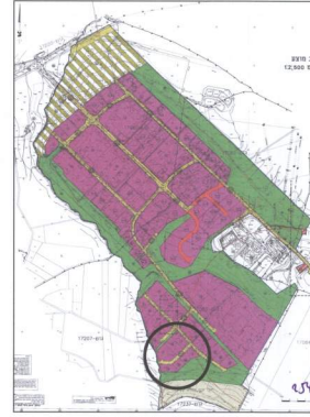
תרשים תבנית 12003/א

הודעה על אישור תכנית מס' 254-0327692 מס' 254-0327692 מס' 254-0327692 מס' 254-0327692