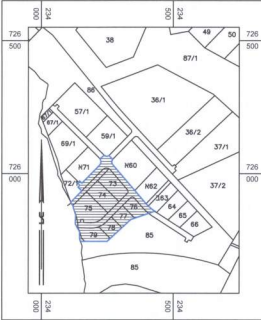
תרשים המקום קנה מידה 1 : 10000