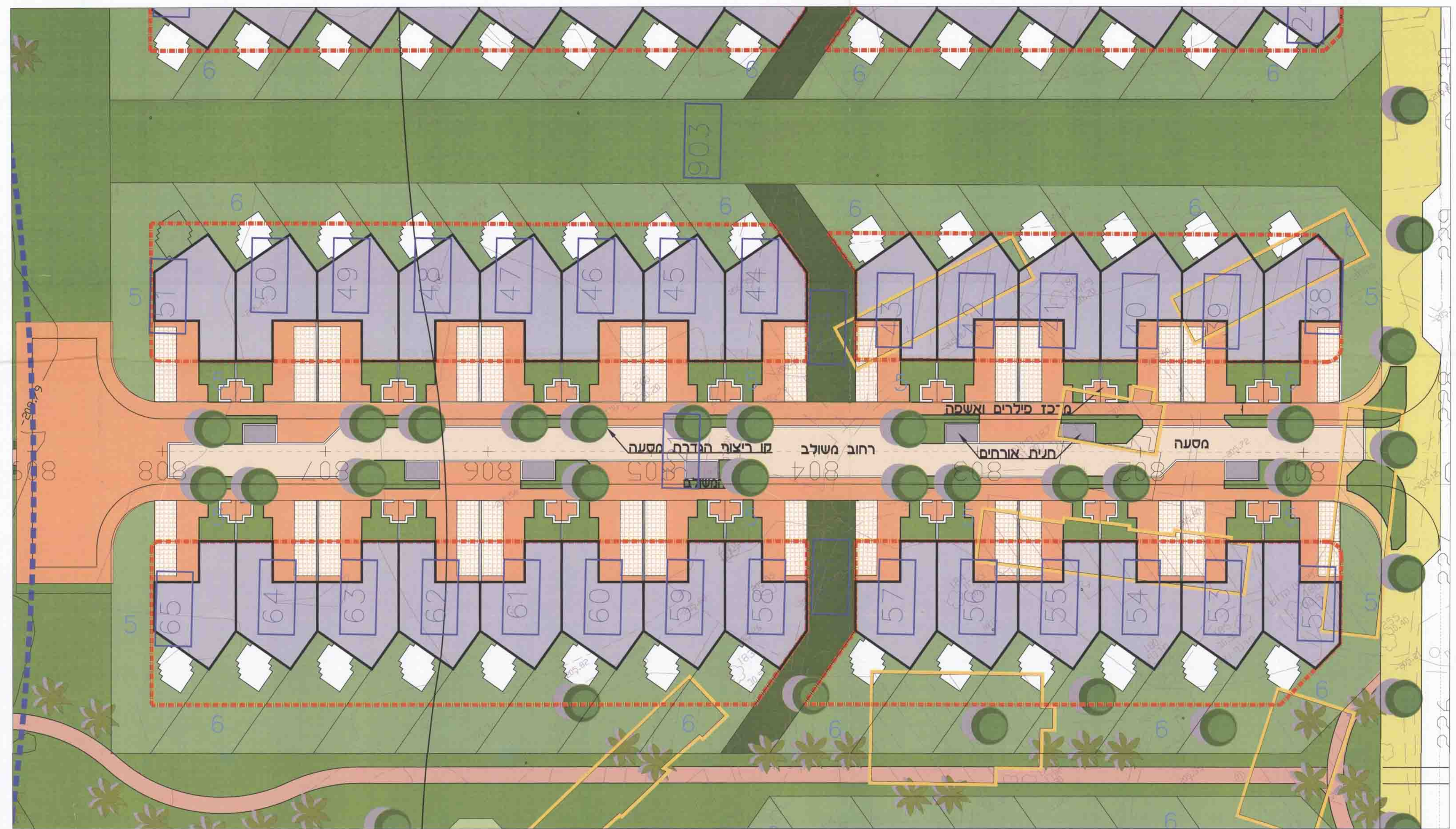
קטע רחוב משולב איזור קוטג'ים