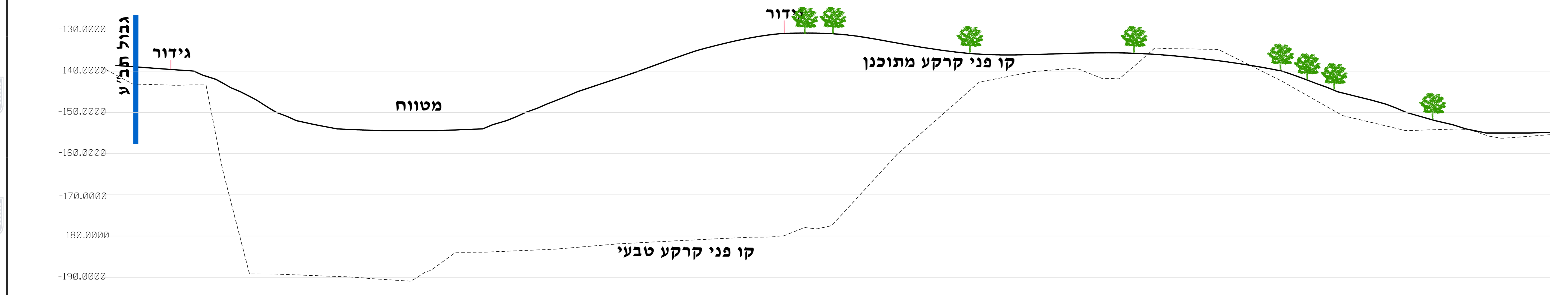
חתך ג-ג קנ"מ 1:500