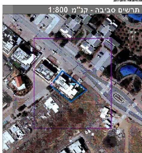
מאזן חניה-לתוספת בניה