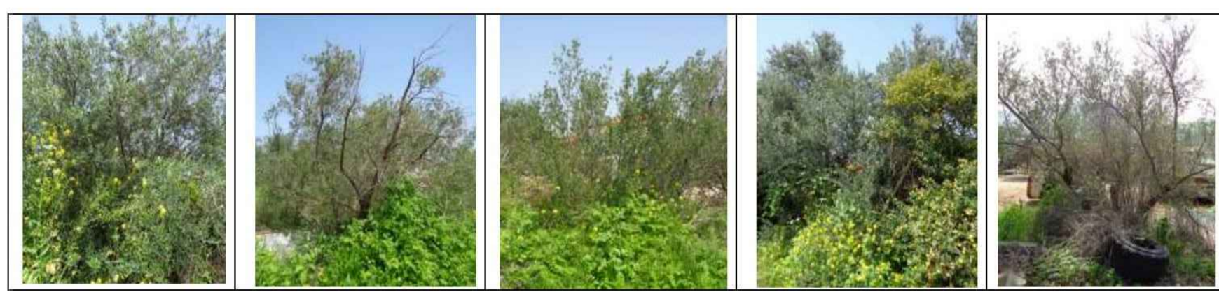
את החומר הזה בפרויקט התמונות של להגיש לסקר היערת יחד עם תכנית הבניה. כל האמור בנוסף עצים בוגרים זה, הוא בגדר המלצה, החלטה סופית תינתן רק ע"י פקד היערת או מרשה מטעמו.