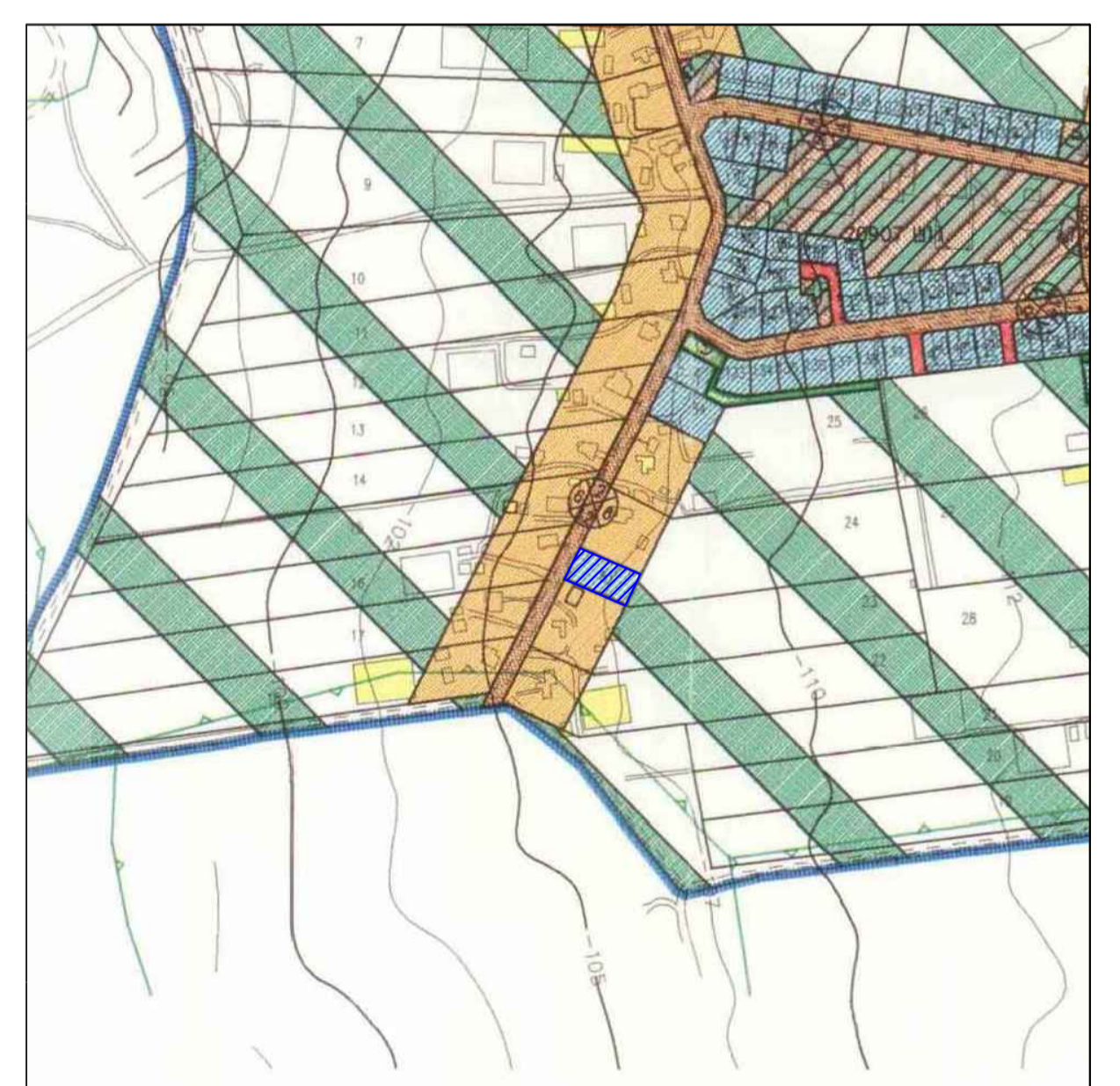
תרשים הסביבה - קנה מידה 1:5000 ע"פ ת.ב.ג. ג/במ/150