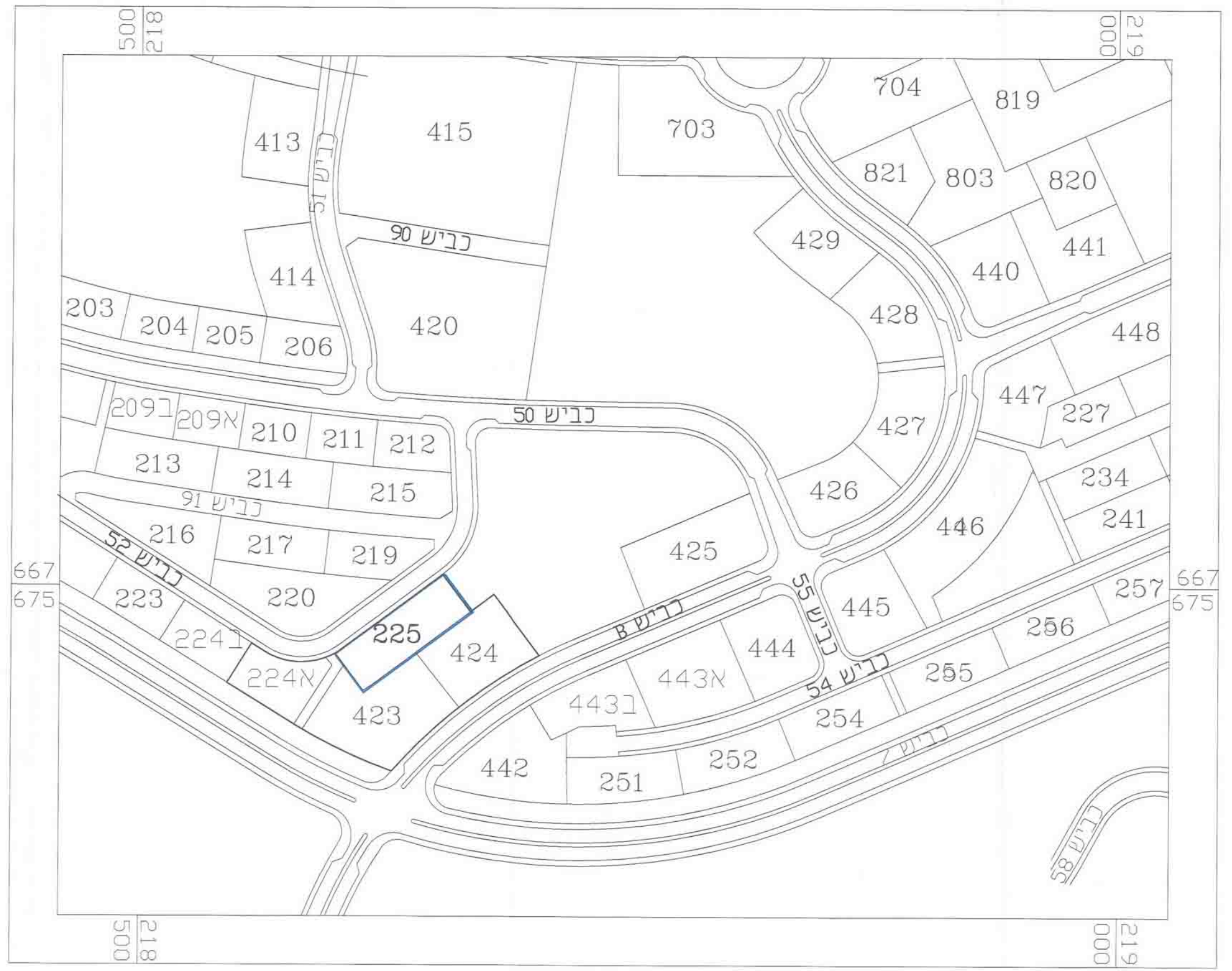
תרשים מקום בקני"מ 1:2500