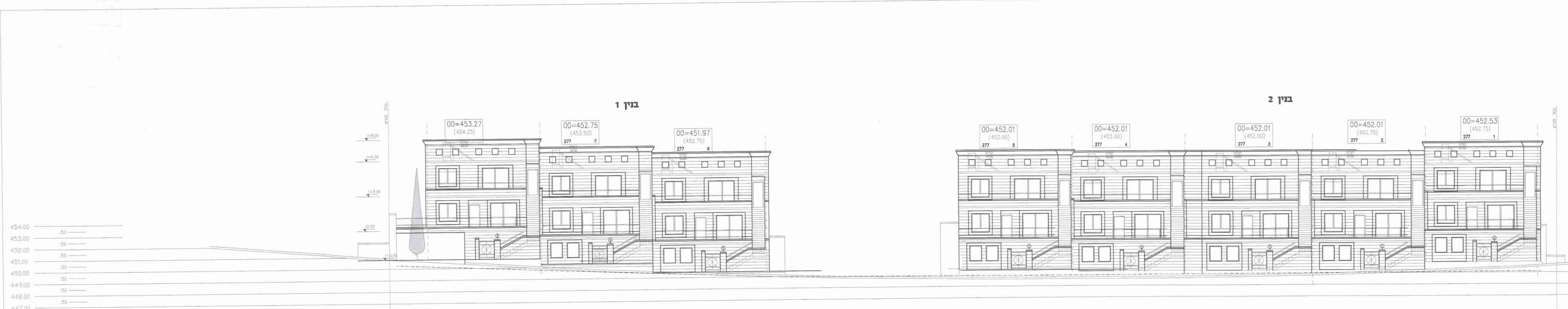
חזית מזרחית מגרש 277

הערות: 1. סולם רשתה רחבה (0.50) האקסטרס יבנה על המעקה פיתוח שטח המגרש 2. מכלילת שטח שטח אמצעות 10 ק"מ שטח נדרש, שטח 10 ק"מ פיתוח 10 ק"מ על המעקה פיתוח שטח המגרש