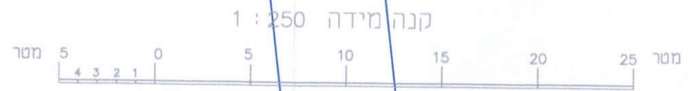
קנה מידה 1:250