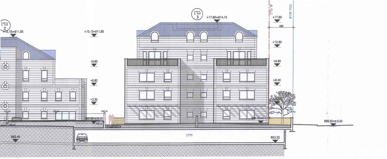
חזית צפונית קני"מ 1:200