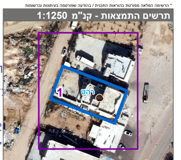
שנת צילום אוויר: 2017-2018