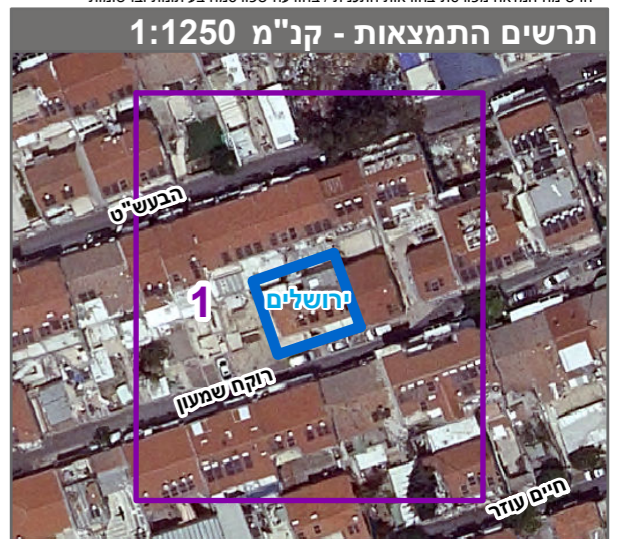
שנת צילום אוויר: 2019