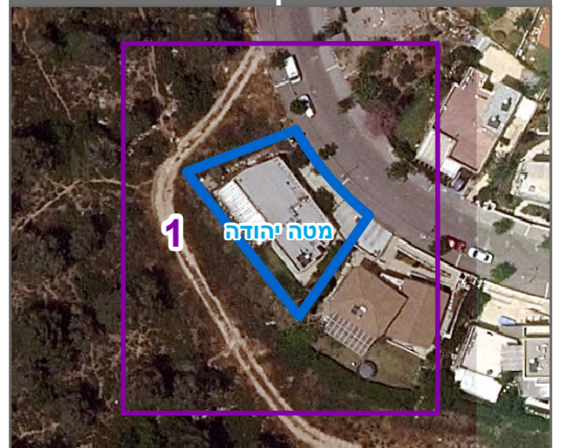
שנת צילום אוויר: 2019