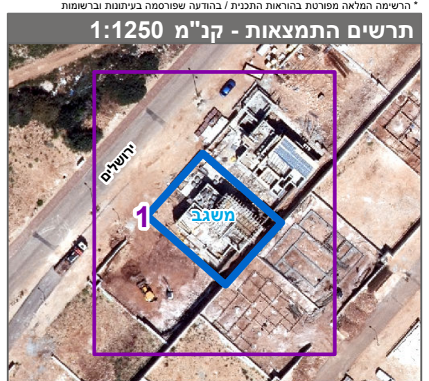
שנת צילום אוויר: 2017-2018