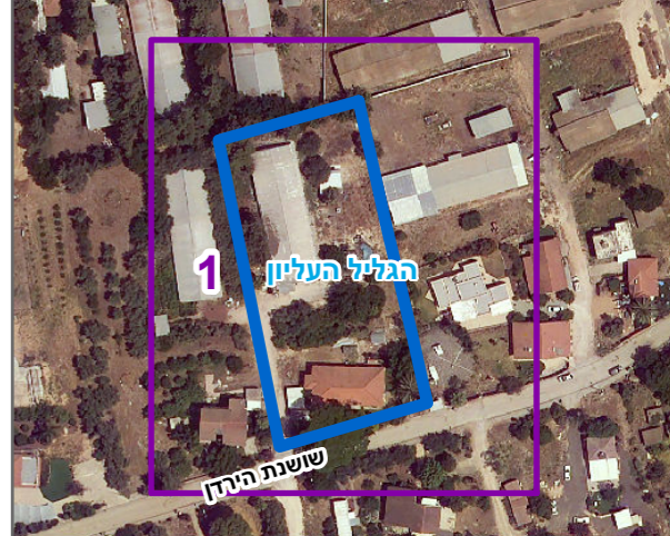
שנת צילום אוויר: 2019