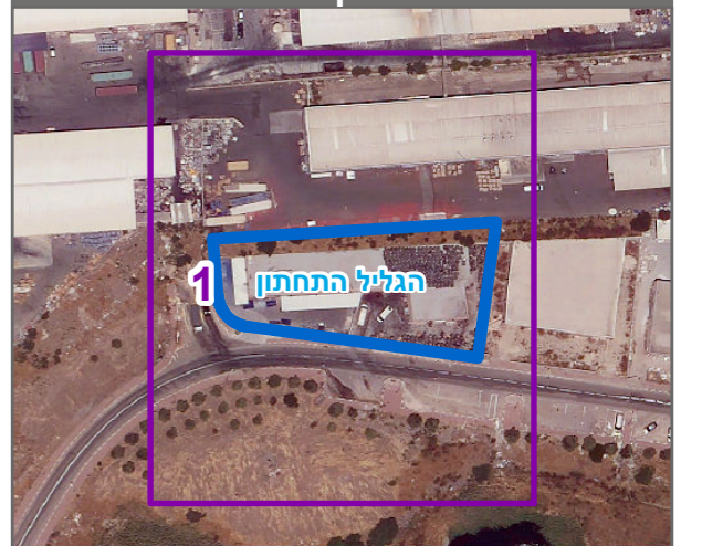
שנת צילום אוויר: 2019