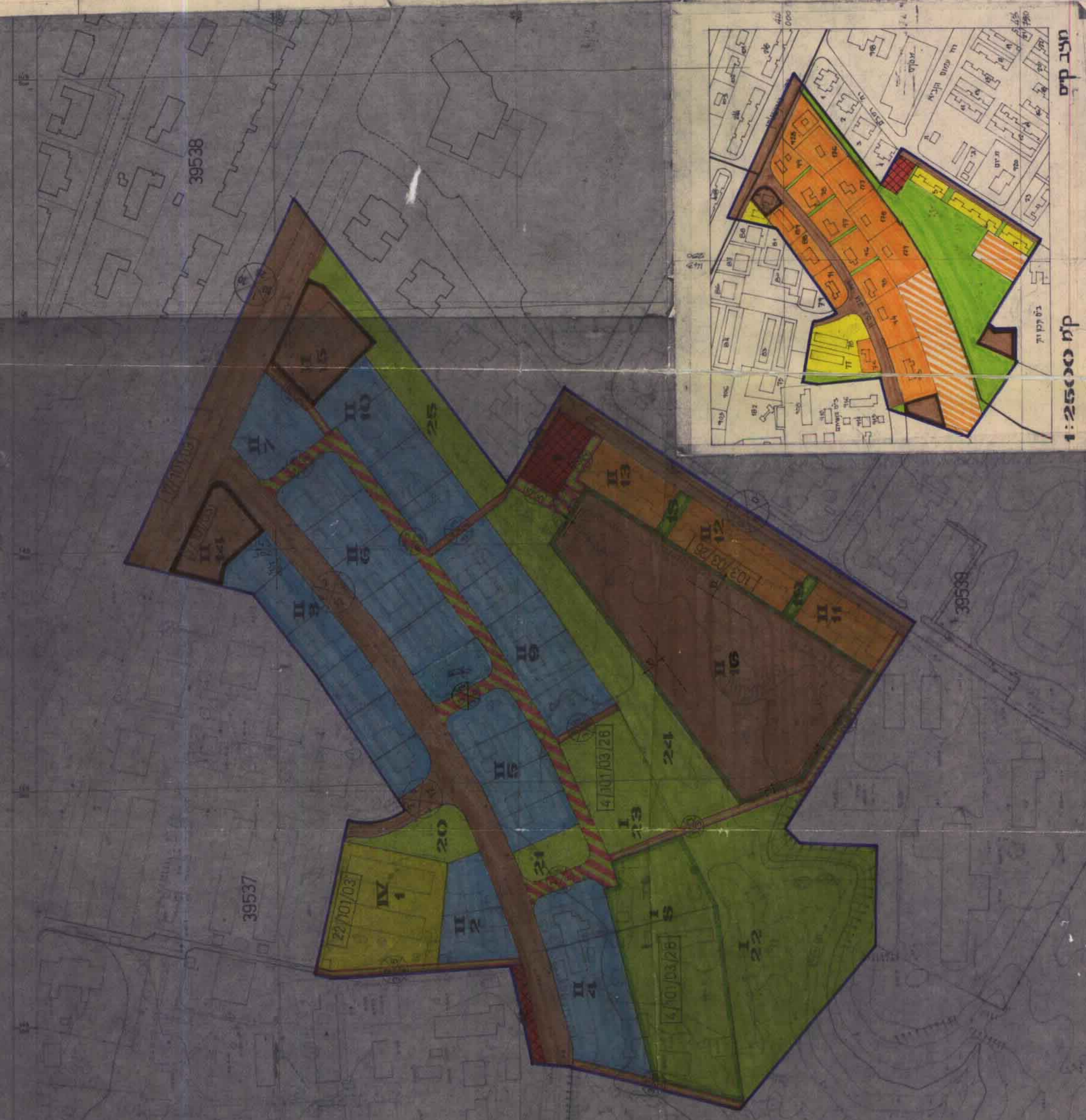
מפת מס' 39537, 39538 קמ 1:2500