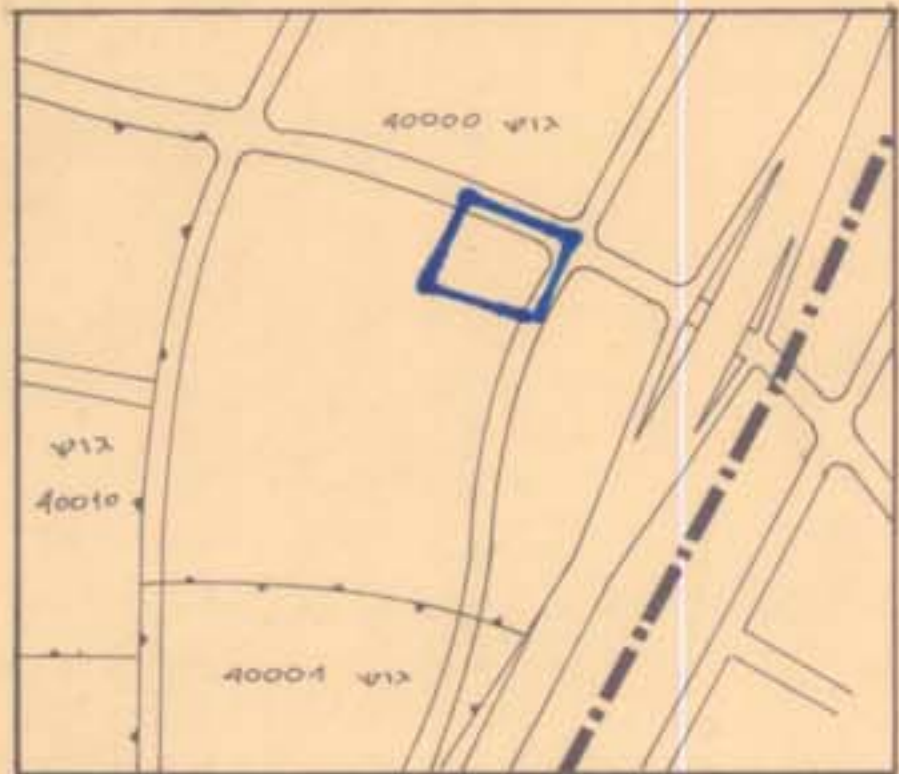
1:10.000 תרשים סביבה