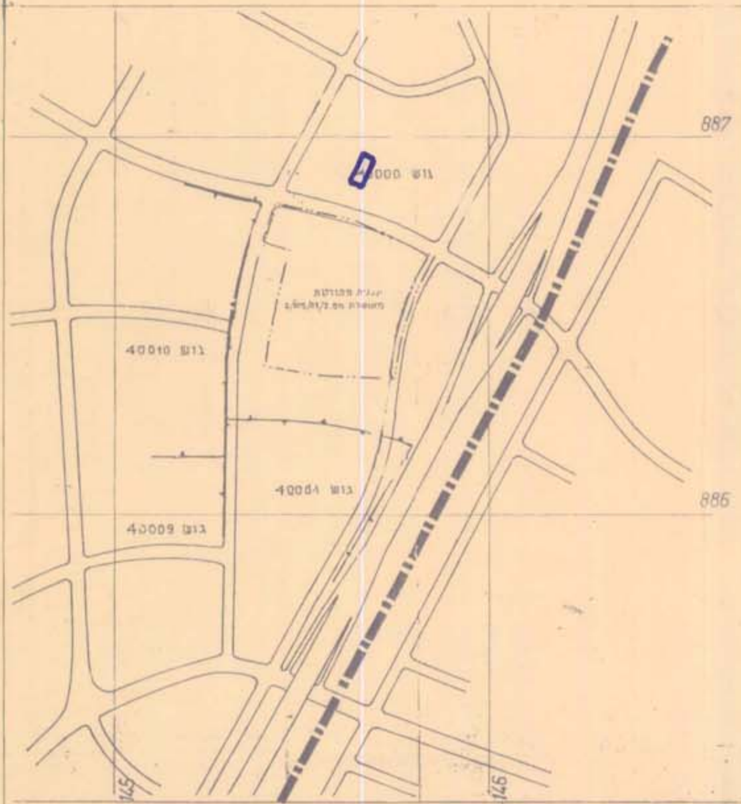
1:100.000 תרשים סביבה

התכנית מס' 18/105/03/2 הוצעה ע"י מינהל מקרקעי ישראל מיום 20.3.88 מס' 7/639