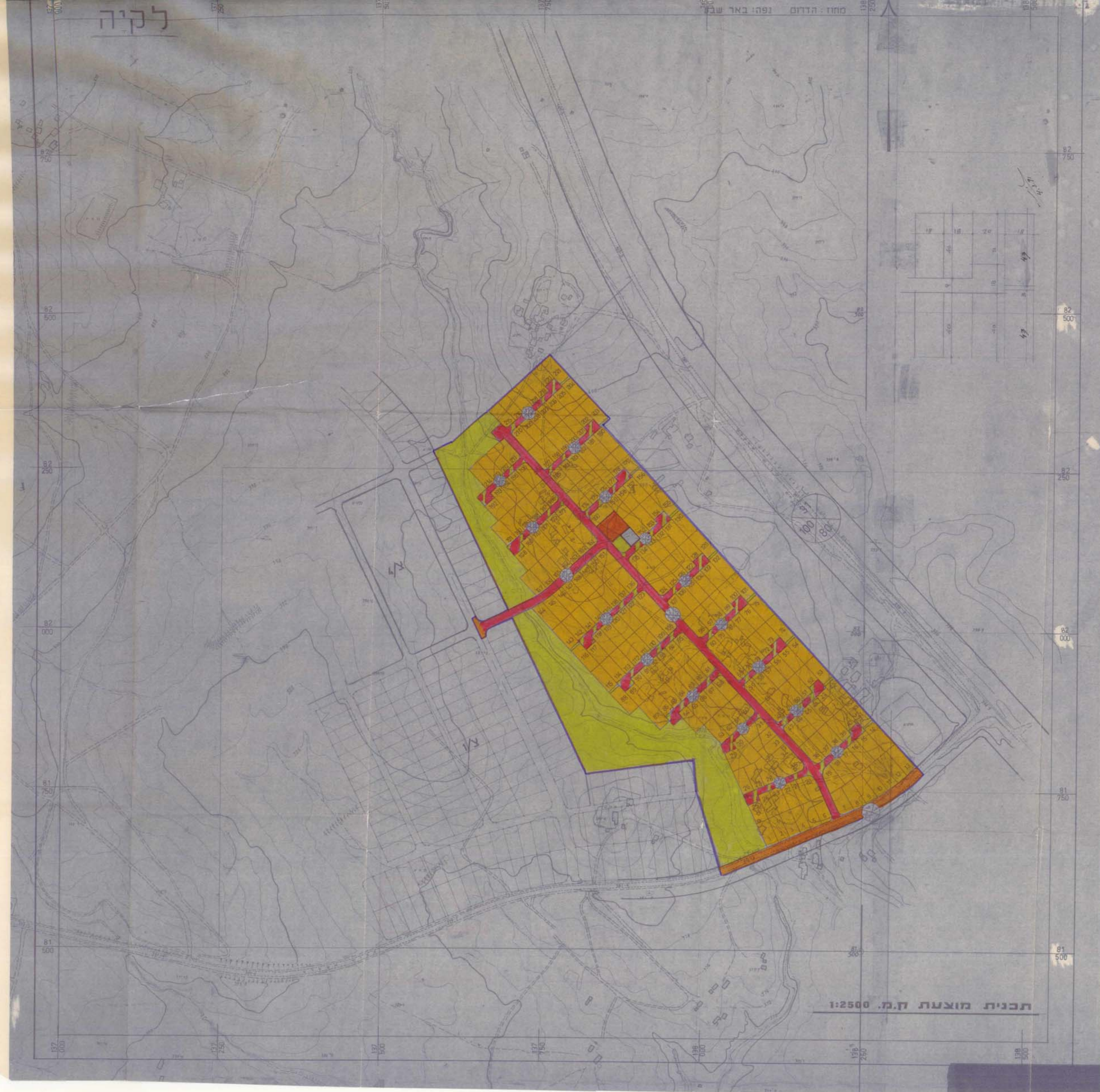
תכנית מוצעת ק.מ. 1:2500

משרד המינס. מ. הדרום תאריך תכנון: 24/7/70 מס. 48.5.91 משרד המינס. מ. הדרום תאריך תכנון: 24/7/70 מס. 48.5.91 משרד המינס. מ. הדרום תאריך תכנון: 24/7/70 מס. 48.5.91