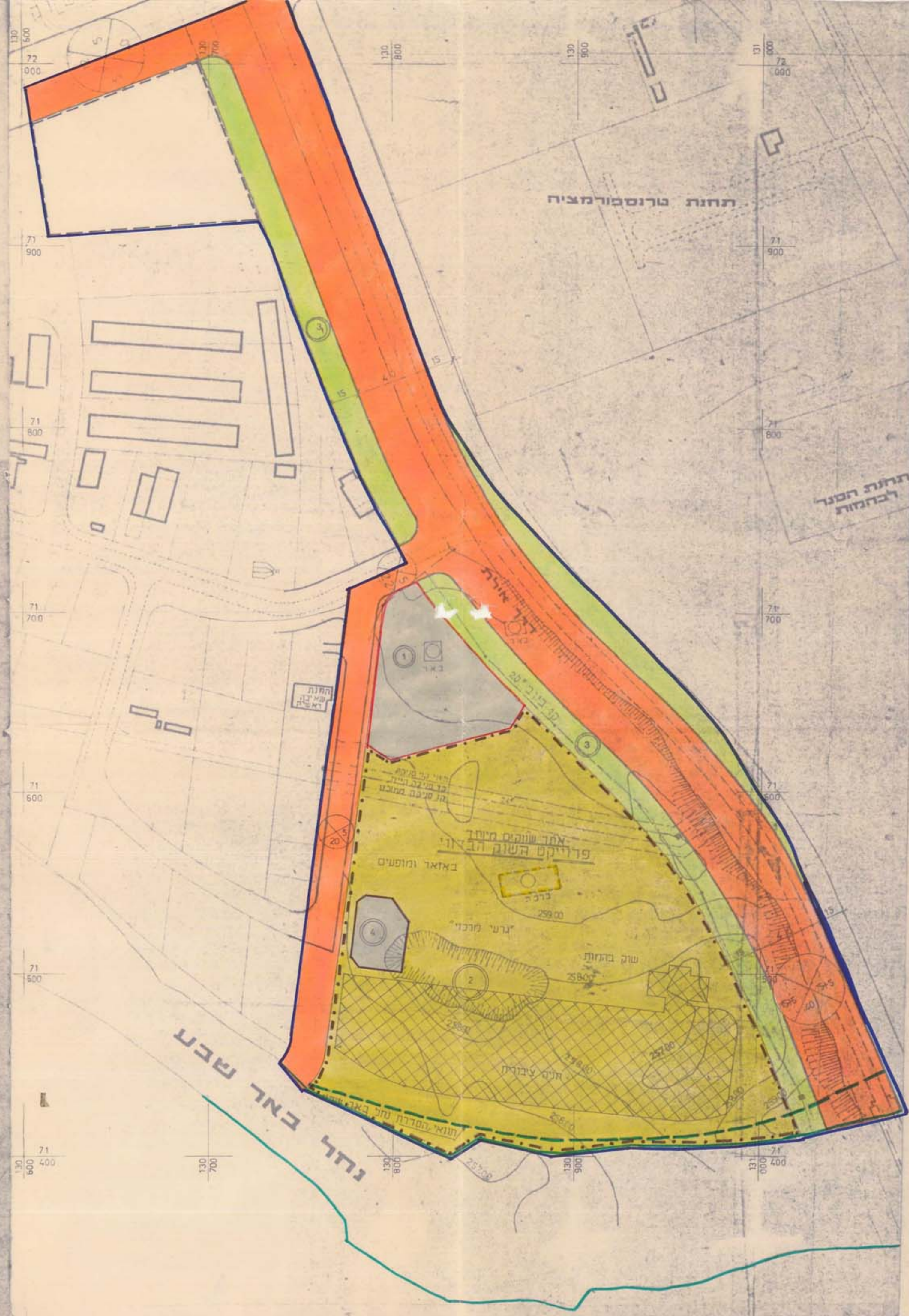
מצב מאושר 1:1250