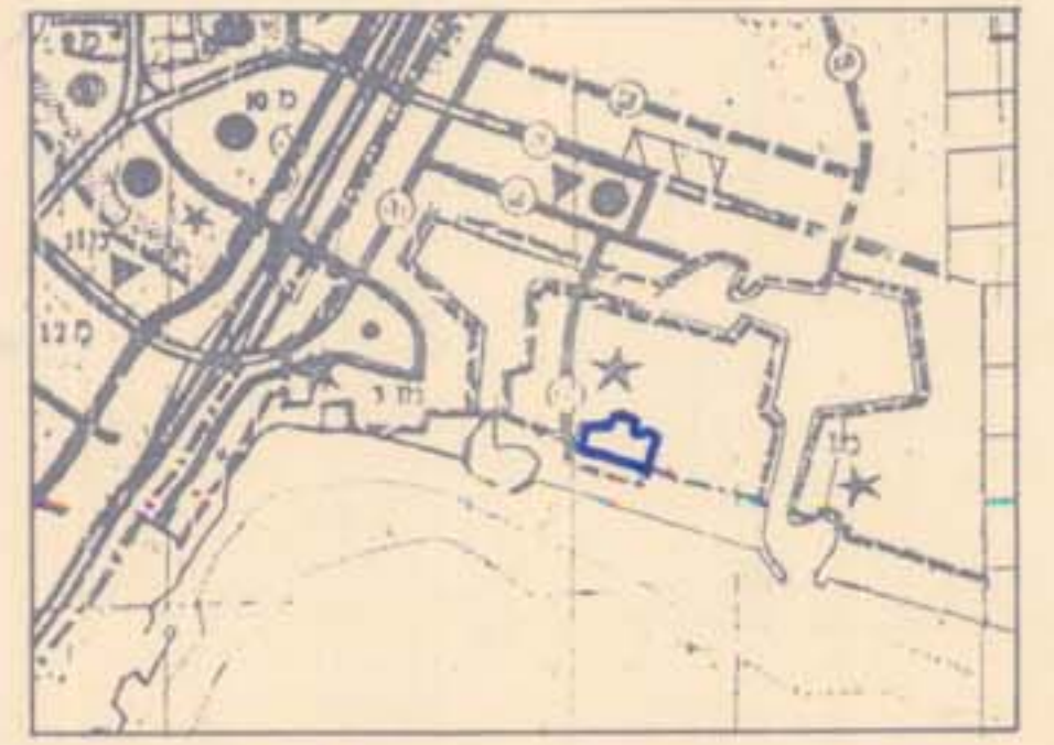
תרשים הסביבה ק.מ. 1:20000