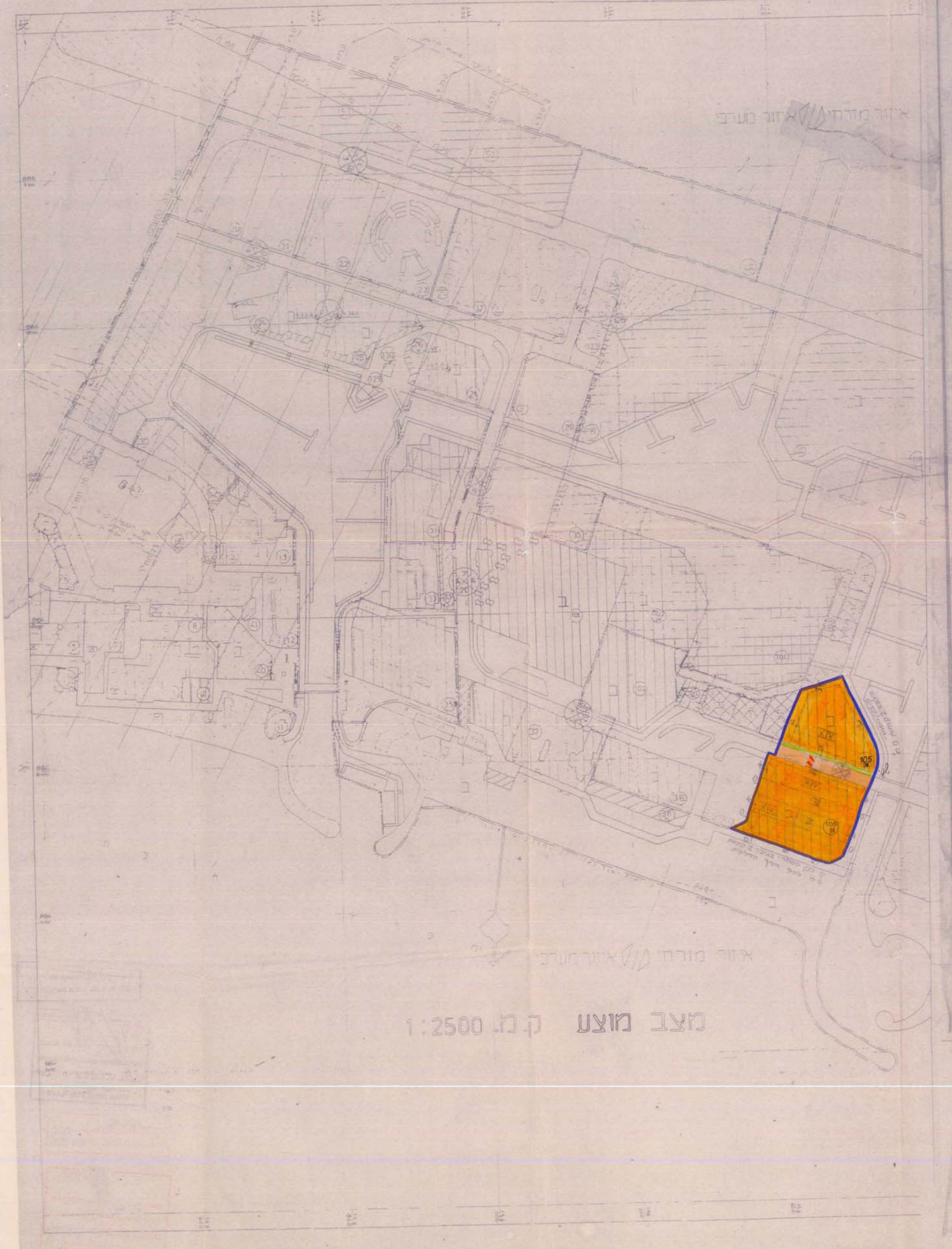
מצב מצע ק.נ. 1:2500