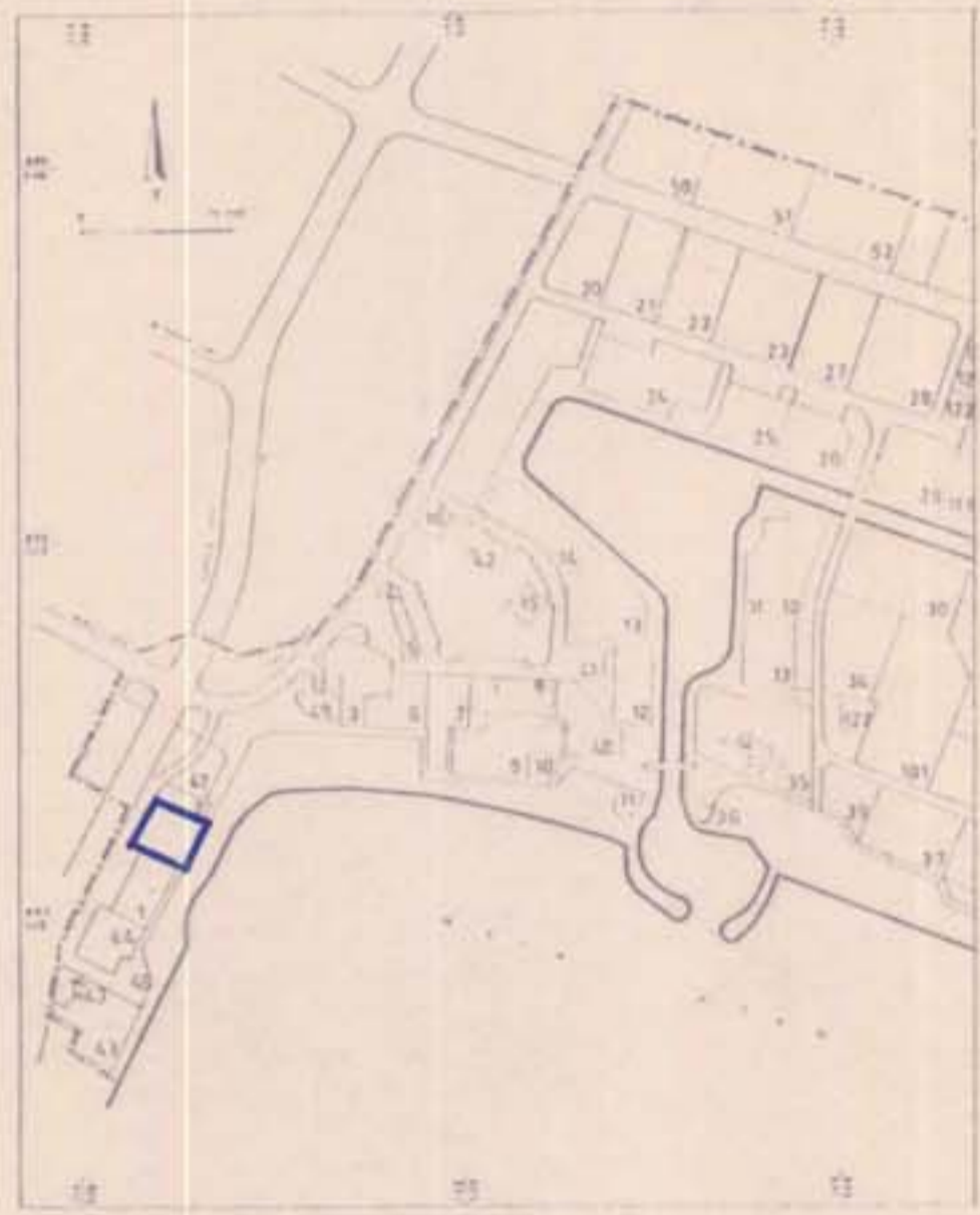
תכנית כללית ק.מ. 1:20000