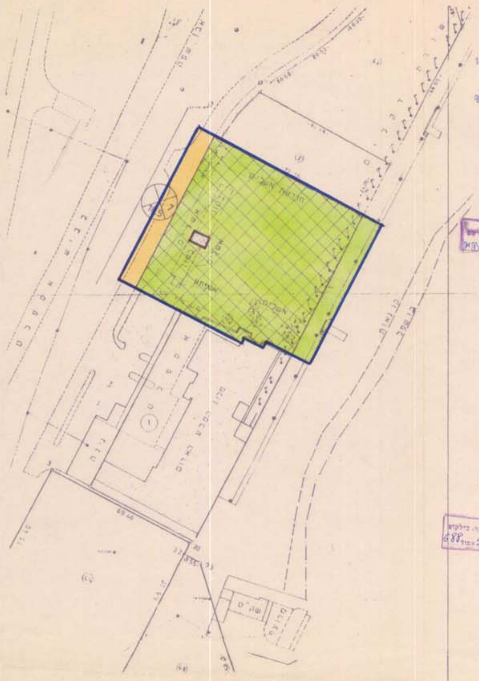
מצב מוצע ק.מ. 1:1000