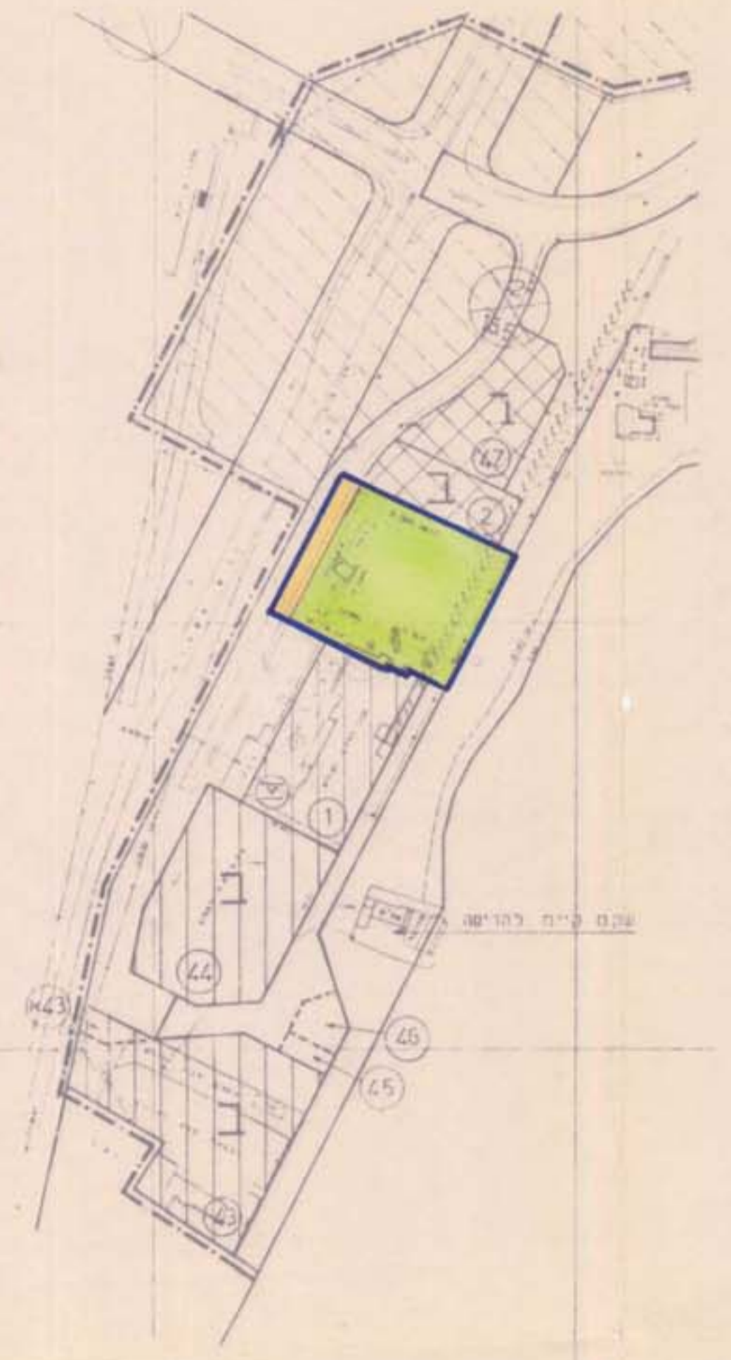
מצב קיים ק.מ. 1:2500