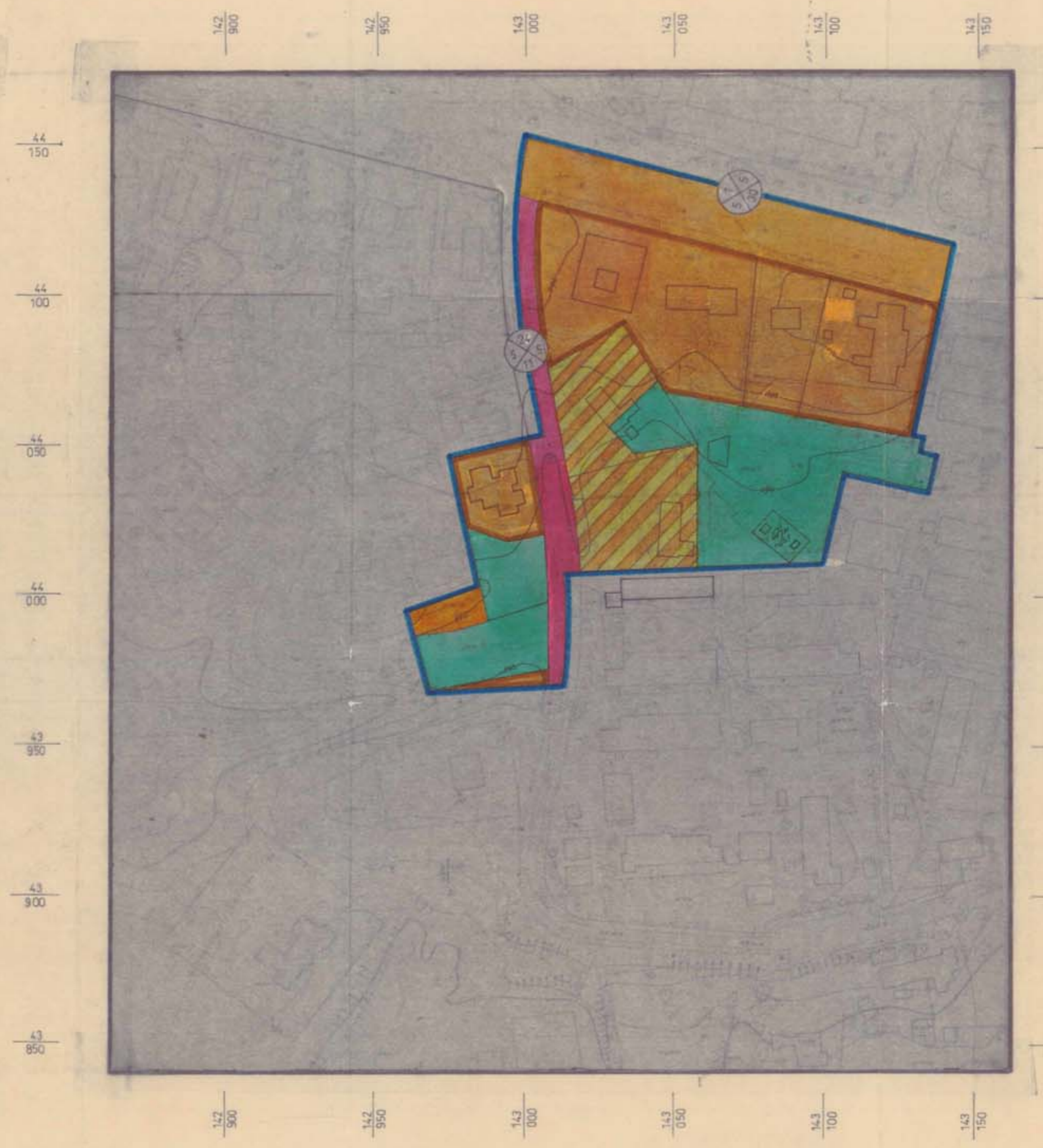
מצב קיים 1:1000

תאריך : תכנית זאת מבוססת על מפת מידה של החברה לפוטוגרמטריה וודגסה בע"מ