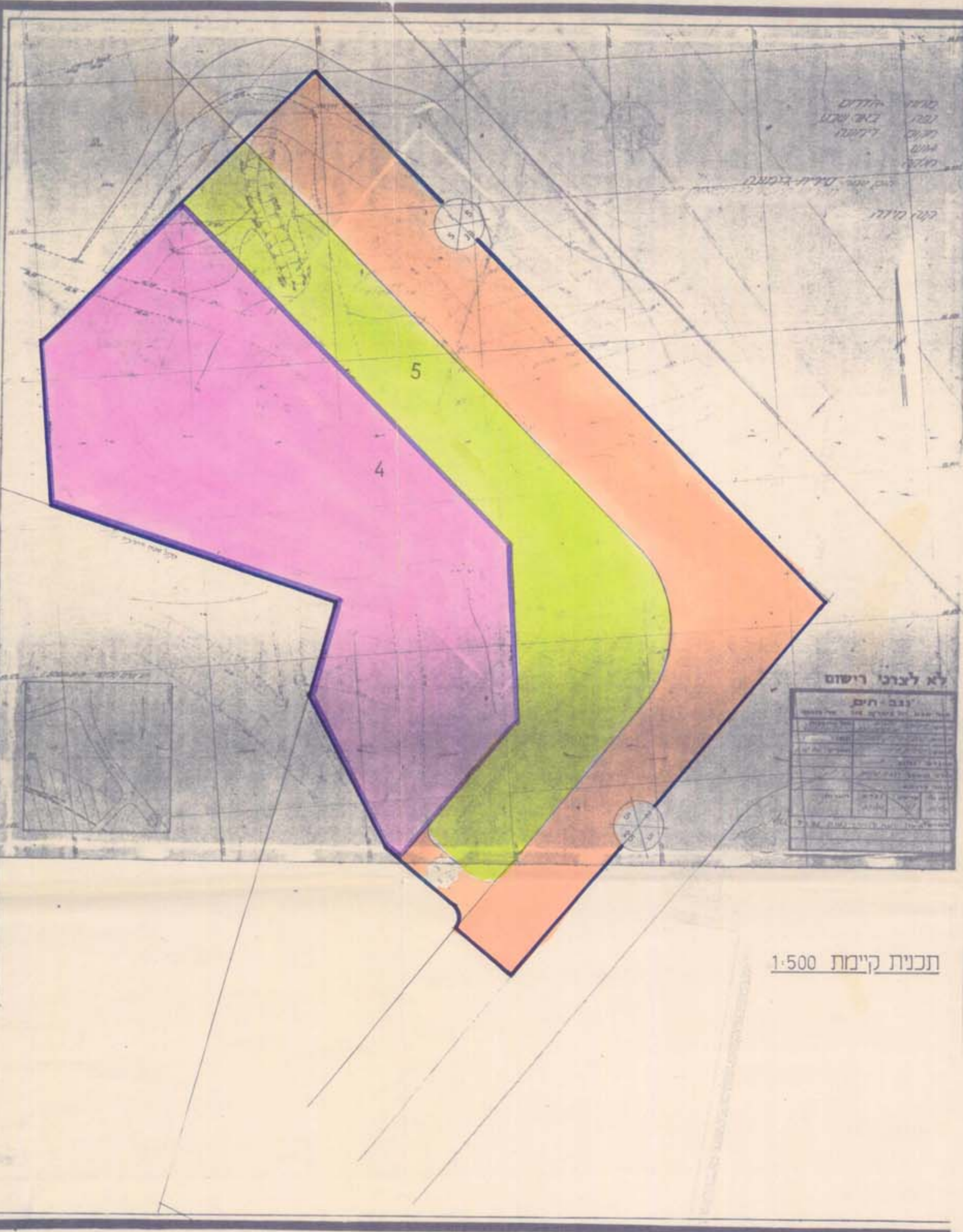
תכנית קיימת 1:500

הודעה על אישור תכנית מס' 122/03/25 א' הורסחה ביקום המטרופוליטני מס' 3768 22/10/03