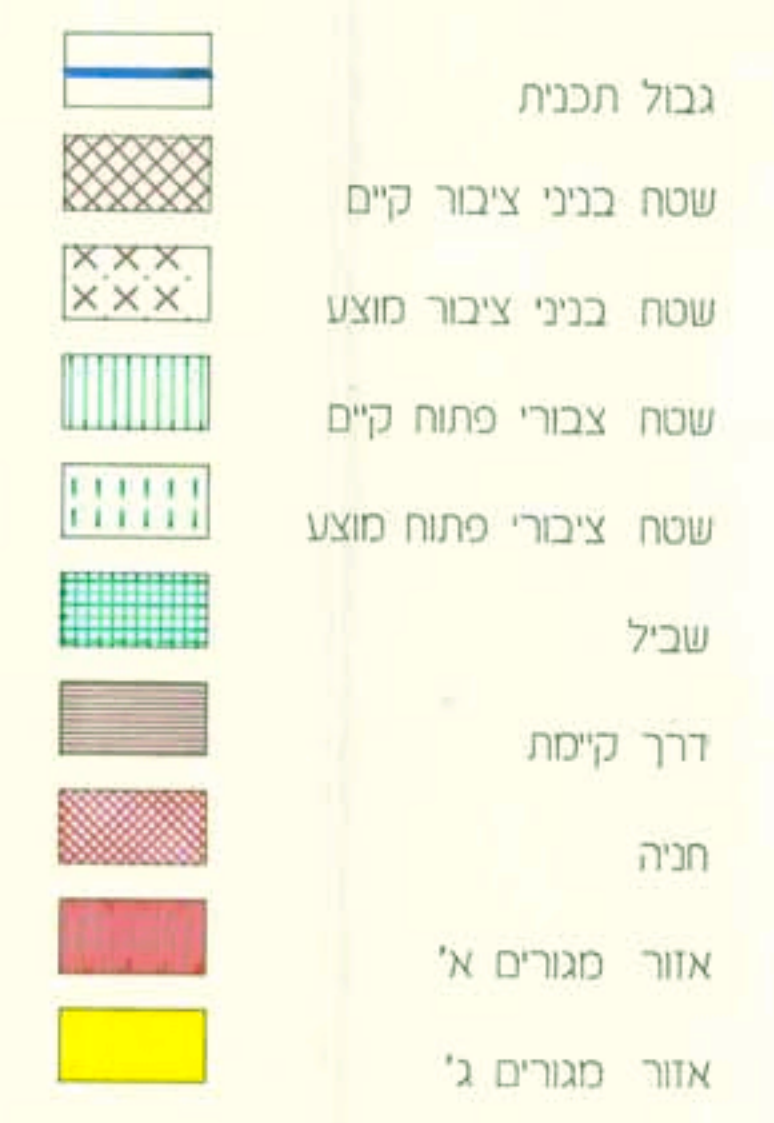
טבלת יעודי שטחים