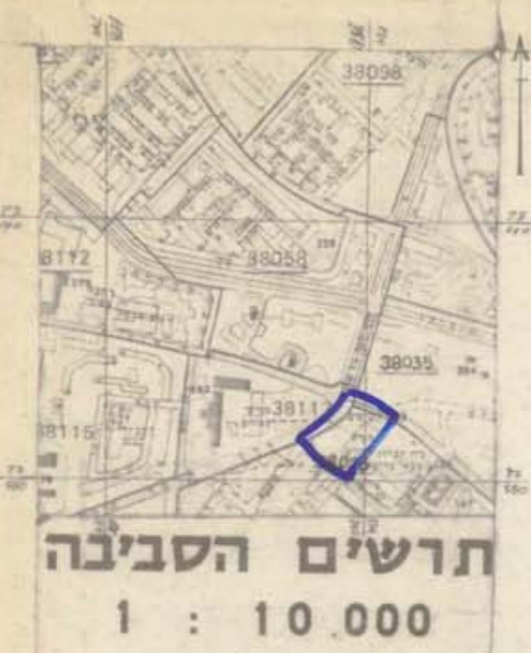
תושים הסביבה 1 : 10 000