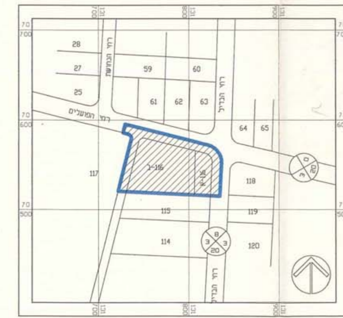
תרשים סביבה קנים 1:2500

מרחב תכנון מקומי באר-שבוע תכנית ספורט מס' 34/167/03/5 שינוי לתכנית ספורט מס' 167/03/5 מס' 22/167/03/5 מס' 28/167/03/5