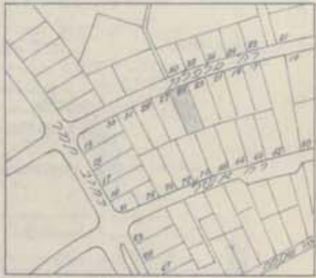
תחום סביבה ללא קום