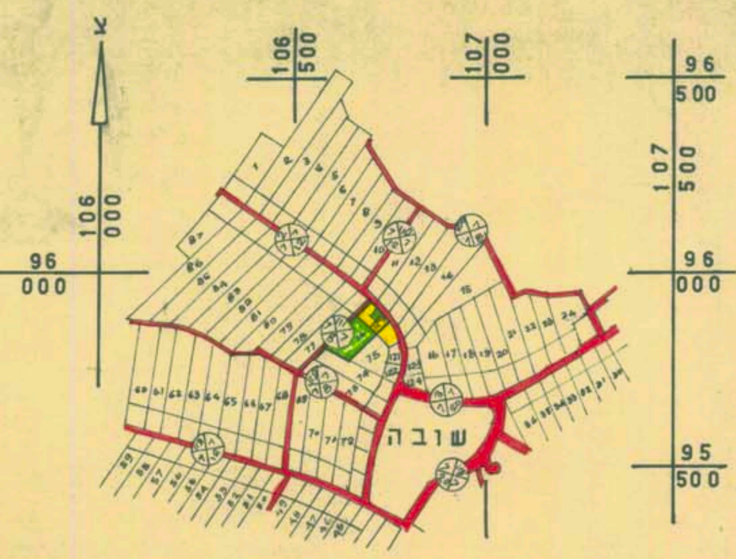
ת.ר.ש.ים הסוביבה: 1:10,000