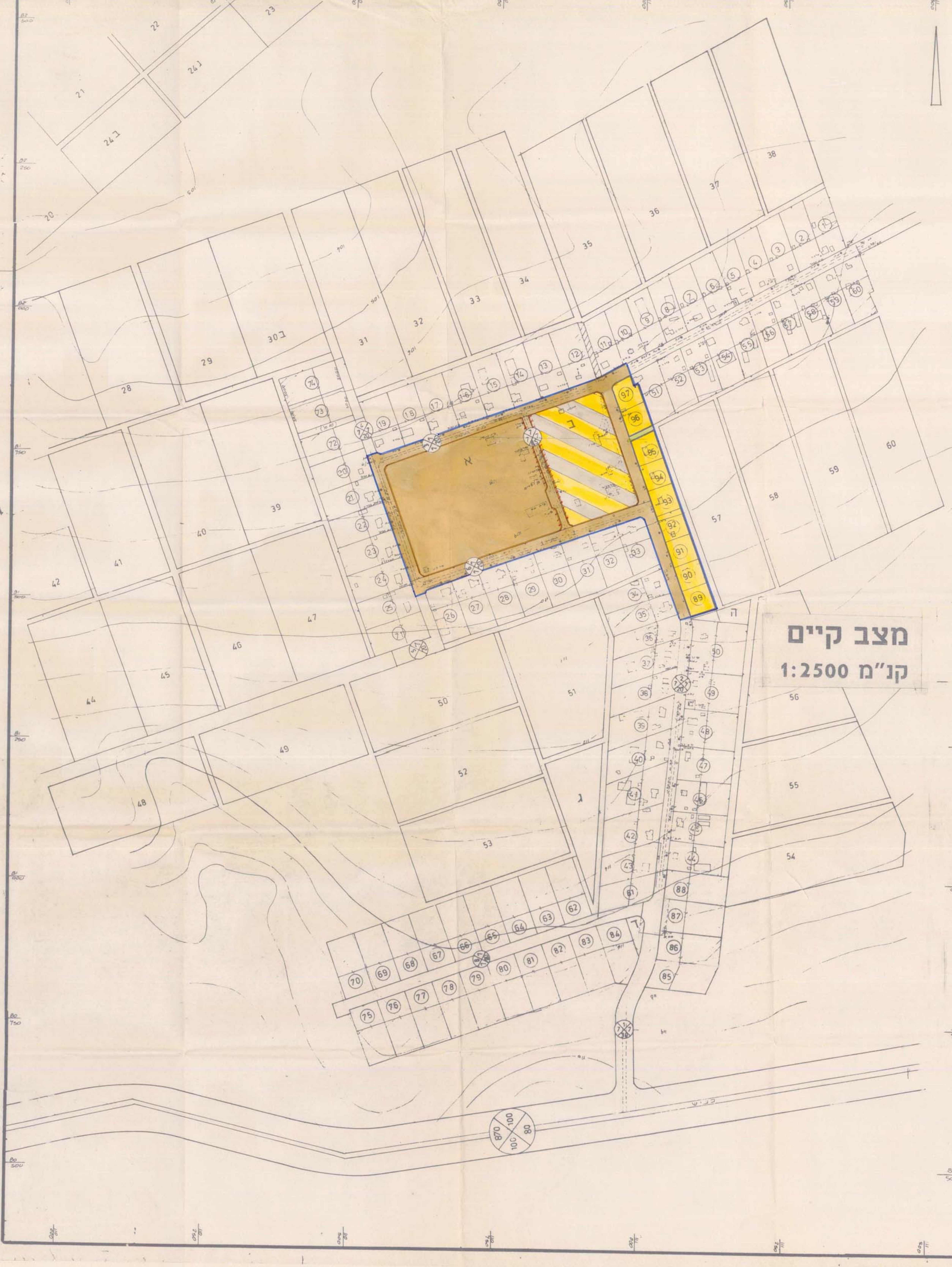
מצב קיים קו"מ 1:2500